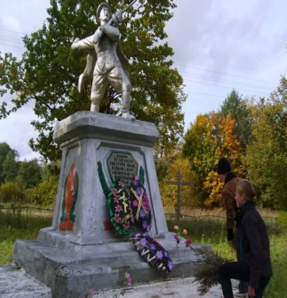
Братское захоронение.