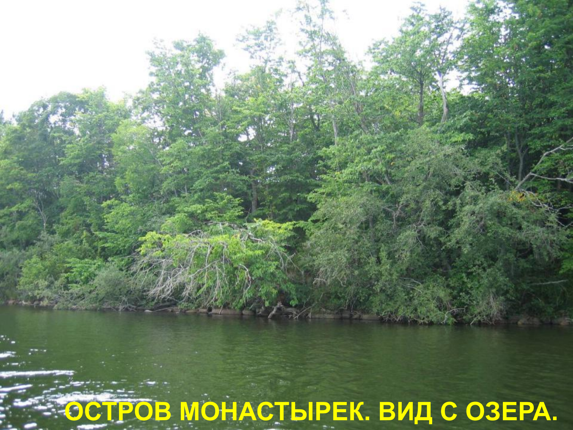
ОСТРОВ МОНАСТЫРЕК. ВИД С ОЗЕРА.