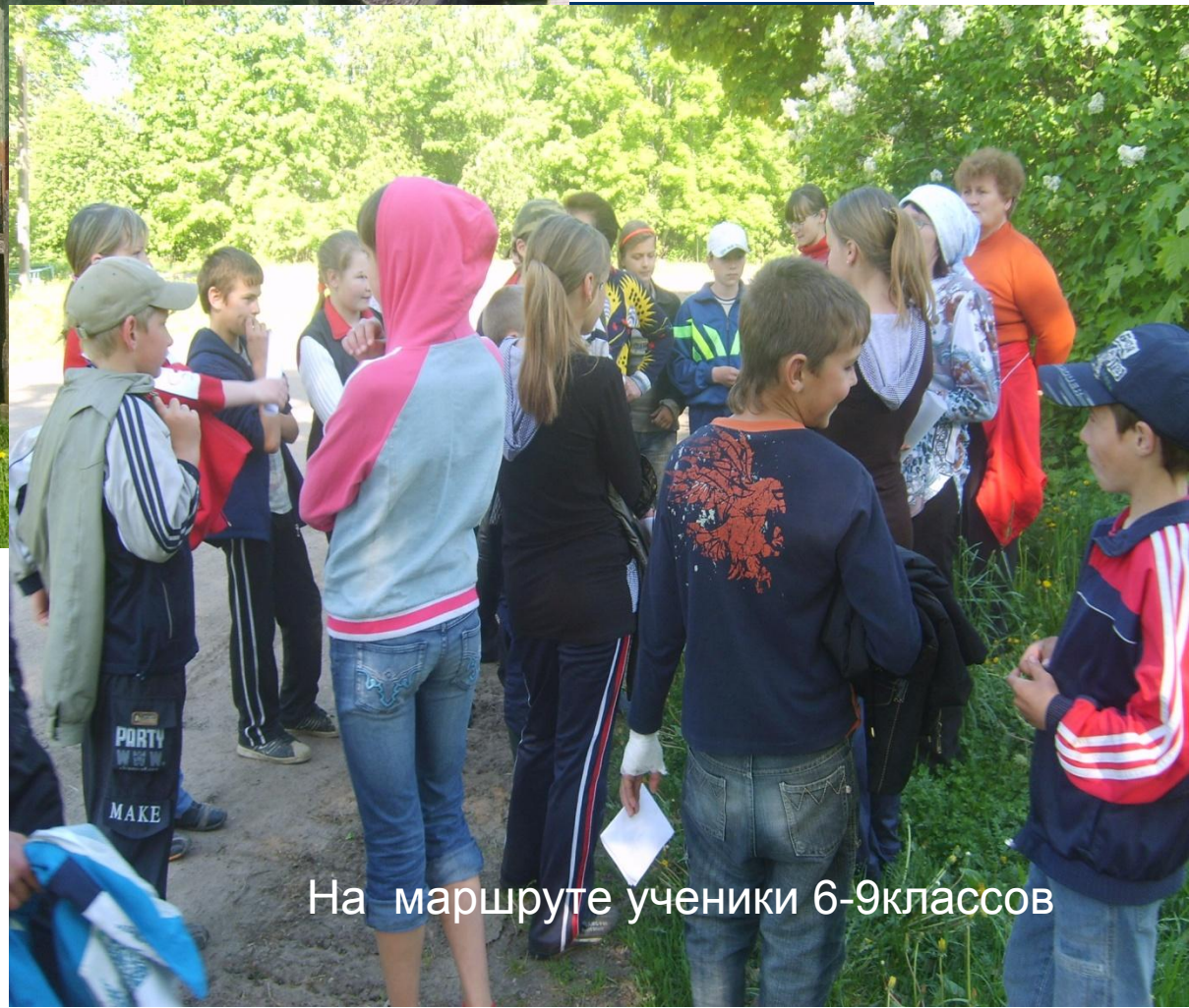
На маршруте ученики 6-9 классов