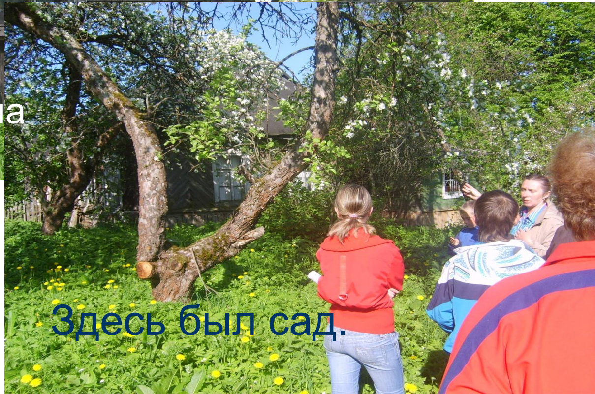
Здесь был сад.