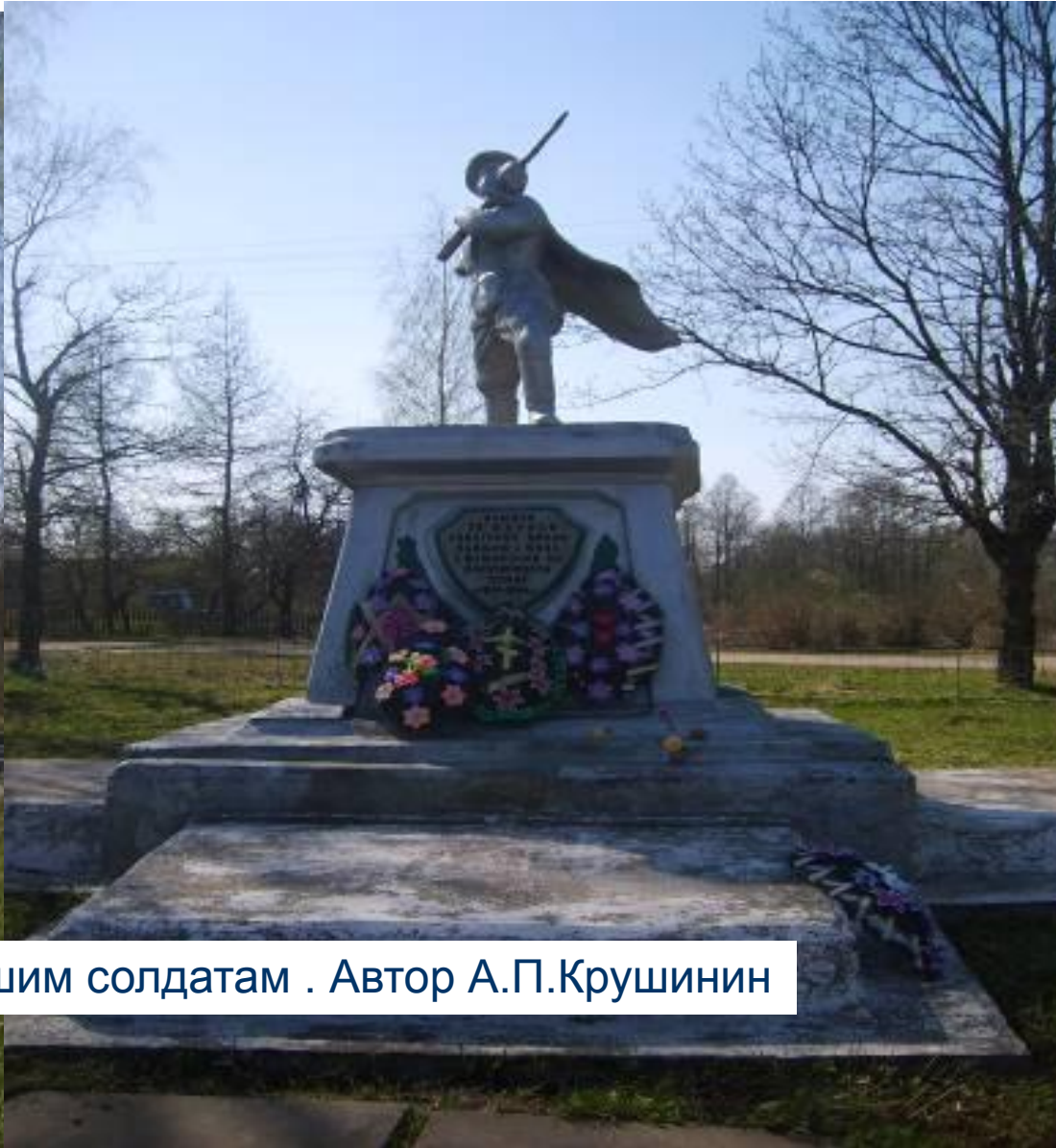
Памятник погибшим солдатам . Автор А.П.Крушинин