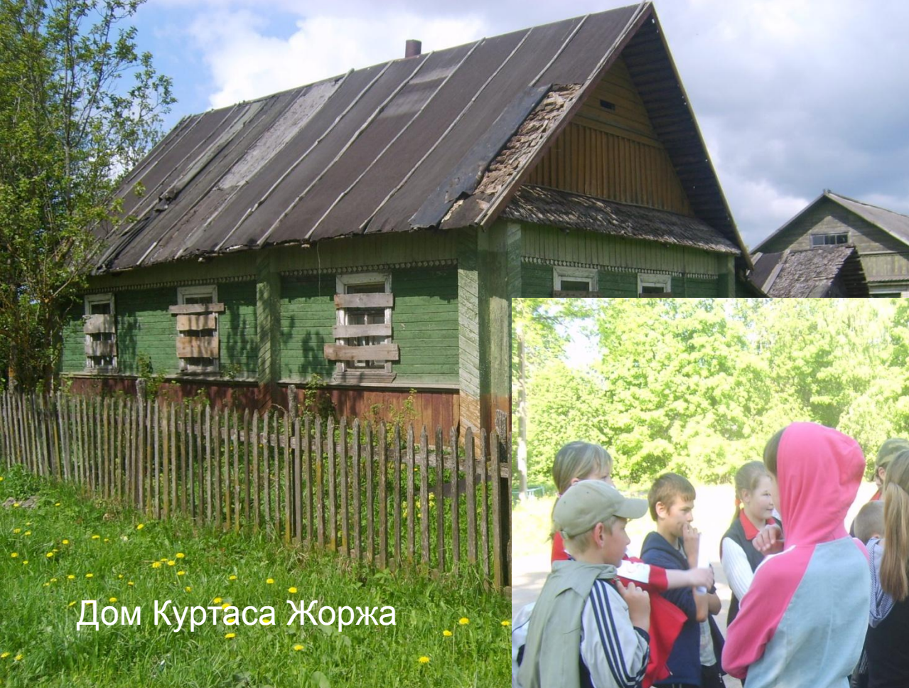
Дом Куртаса Жоржа