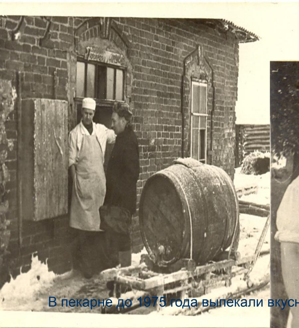
В пекарне до 1975 года выпекали вкусный хлеб.