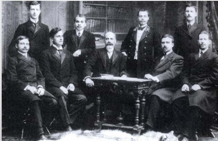
Заседание правления «Маяка»