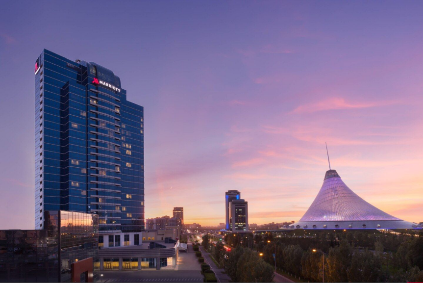
Astana Marriott Hotel