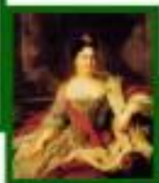
Екатерина I 1725-1727