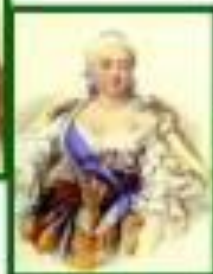
Елизавета Петровна 1741-1761