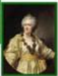
Екатерина II 1762-1796