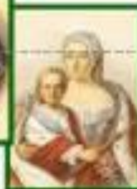
Иван VI Антонович и Анна Леопольдовна 1740-1741