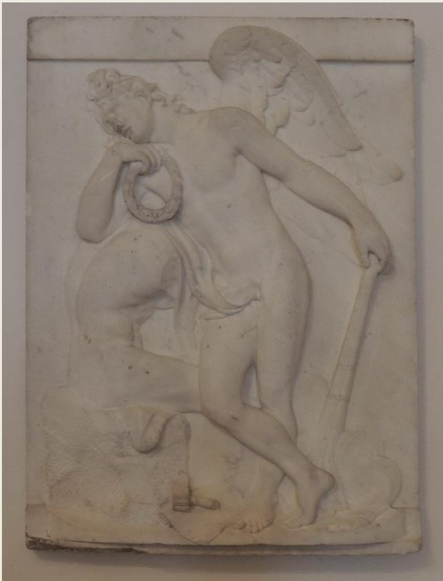
Рельеф с надгробия М. Козловского