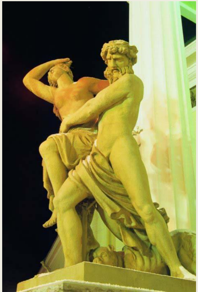
В. Демут-Малиновский «Похищение Прозерпины»