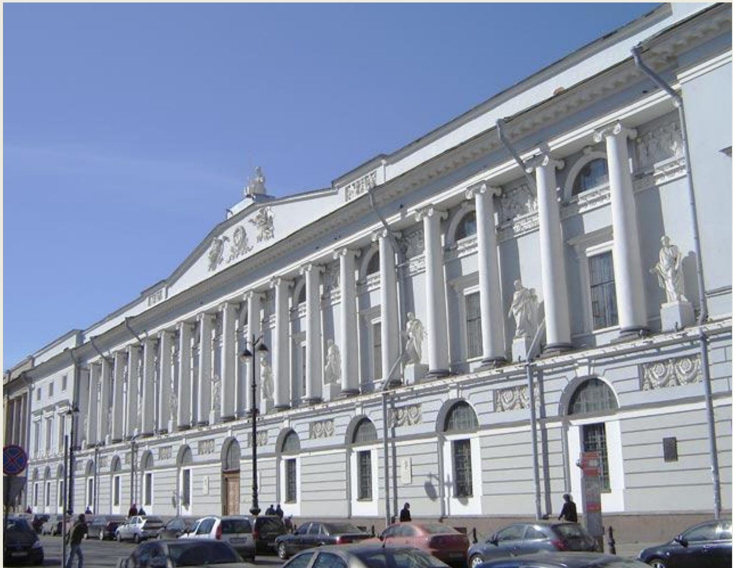
Здание Императорской публичной библиотеки