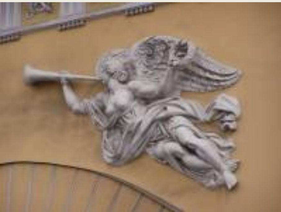
И.И. Тербенёв. Гений Славы, трубящий победу на арке Адмиралтейства