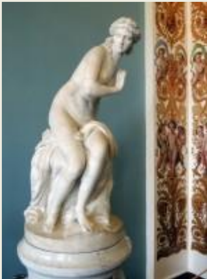
Ф. Ф. Щедрин. «Диана» (1795). Государственный Русский музей (Петербург)

Он украшал Казанский собор, выполнил огромный горельеф «Христос, ведомый к месту распятия» (1807). Занимался также и скульптурой малых форм: выполнил ряд бюстов и отдельных скульптур: «Спящий Эндимион» (бронза, 1779), «Фавн с Вакханкой», «Диана», «Венера» (1792), «Нарцисс», бюст А. Н. Нартова (мрамор, 1811).