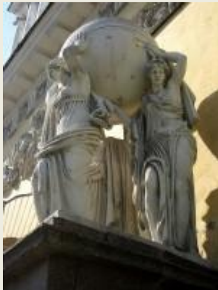
Ф.Ф. Щедрин. Кариатиды в Адмиралтействе (1812-1813)