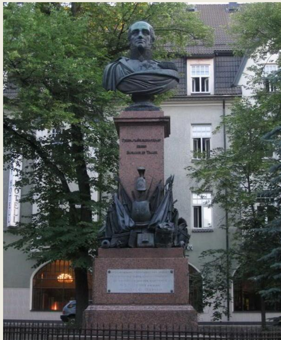
В. Демут-Малиновский. Памятник Барклаю-де-Толли (Тарту, 1849)