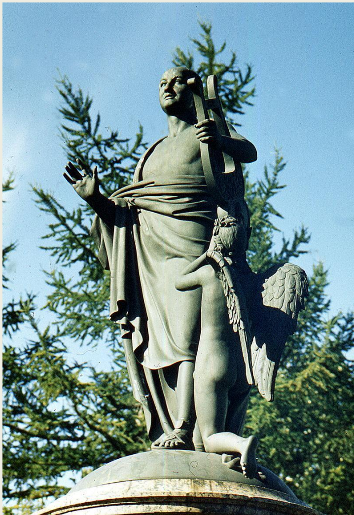
Памятник Ломоносову в Архангельске