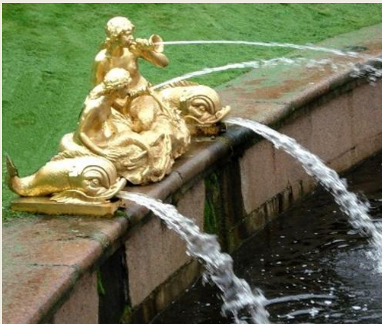
Ф.Ф. Щедрин. Фонтан «Сирены» в Большом каскаде Петергофа (1805)