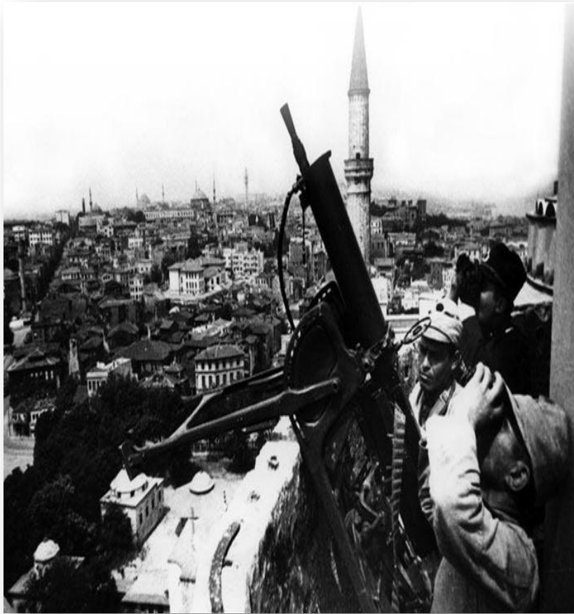
Пулемёты MG 08 на минарете Ай-Софии в Стамбуле в качестве зенитных орудий. Сентябрь 1941 года

Весной и летом 1939 года, когда Гитлер готовился к открытию военных действий в Европе, Турция заняла видное место в расчетах как Германии, так и англо-французского блока. Прибывший в апреле 1939 года в Анкару германский посол фон Панен, намеревался присоединить Турцию к фашистской «оси» (по термину «ось Рим — Берлин», известной также как нацистский блок — агрессивный военный союз Германии, Италии, Японии и других государств, которому противостояла во время Второй мировой войны антигитлеровская коалиция). С другой стороны, Англия и Франция, заинтересованные в использовании турецких портов и турецкой территории, вели сложные переговоры с Турцией, добиваясь включения ее в англо-французский блок.