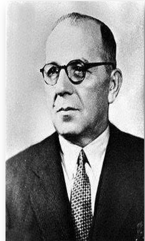
Мехмет Шюкрю Сараджоглу — турецкий государственный деятель и шестой премьер-министр Турции (1942—1946)

1 сентября 1939 года гитлеровская Германия напала на Польшу. Через два дня Англия и Франция объявили Германии войну. За неделю до начала боевых действий после провала британско-франко-советских переговоров был подписан советско-германский договор о ненападении. В двадцатых числах сентября в Москву прибыл турецкий министр иностранных дел Сараджоглу для переговоров о заключении пакта взаимопомощи между Турцией и СССР. В то же время советско-турецкие переговоры были продолжены в сентябре—октябре 1939 года во время визита в Москву министра иностранных дел Турции Ш. Сараджоглу. Переговоры не увенчались успехом по нескольким причинам. Во-первых, турки уже имели секретную предварительную договорённость о заключении турецко-британо-французского военного союза, а во-вторых Советский Союз в ходе переговоров, стараясь учитывать интересы Германии и уравновесить договор с учётом турецких предложений, выдвинул турецкому правительству ряд неприемлемых для него условий. Потерпев неудачу, Сараджоглу выехал обратно в Турцию. Когда он был еще в пути, 19 октября 1939 года, в Анкаре состоялось подписание англо-французского договора о взаимной помощи. Тем самым Турция включилась в англо-французский блок.