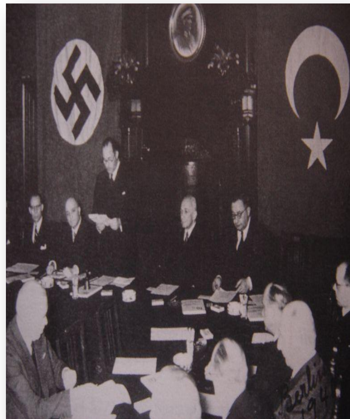
Подписание турецко-немецкого договора о дружбе 18 июня 1941 года

18 июня 1941 года, за четыре дня до нападения гитлеровской Германии на Советский Союз, в Анкаре был подписан турецко-германский пакт «о ненападении и дружбе». Для Гитлера этот пакт, обезопасивший балканский фланг фашистских войск, был последним звеном в подготовке войны против СССР. Для Турции же он означал открытое присоединение к антисоветской политике гитлеровской Германии. С началом Великой Отечественной войны Советского Союза Турция, несмотря на наличие советско-турецкого договора о дружбе и несмотря на объявленный ею формальный «нейтралитет», стала всемерно помогать немцам. 9 октября 1941 года между Турцией и Германией было подписано новое торговое соглашение, предусматривавшее товарооборот в сумме 100 миллионов турецких лир, причем Турция в обмен на поставляемые Германией военные материалы обязались снабжать немцев медью, а с 1943 года и хромом. Осенью 1942 года Турция сосредоточила значительные военные силы на кавказской границе, ожидая падения Сталинграда. Эти действия Турции весьма осложнили задачу советских войск, отражавших вторжение немецких фашистов на Северный Кавказ.