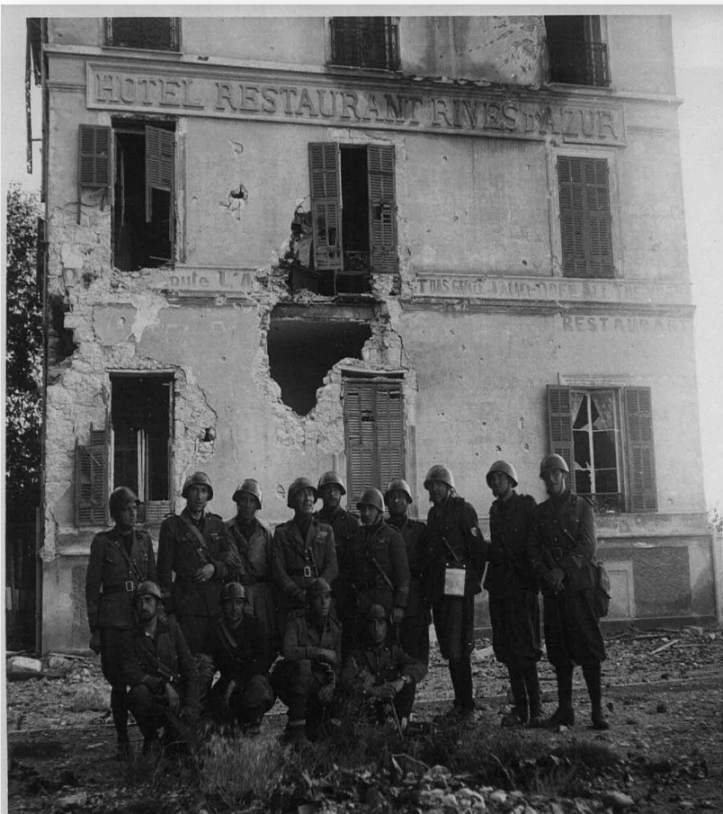
Итальянское вторжение во Францию

Нападение Италии на Францию 10 июня 1940 года создало обстановку, предусмотренную англо-франко-турецким договором: военные действия распространились на зону Средиземного моря. Но Турция уклонилась от помощи своим союзникам. Поражение Франции и слабость Англии создали в турецких правящих кругах мнение, что представляется более выгодным сблизиться теперь с Германией. В июле 1940 года Турция заключила с Германией торговое соглашение. По распоряжению турецкого правительства было разрешено издание немецко-фашистской газеты «Тюркише Пост». В своих публичных выступлениях турецкие деятели старательно избегали точного определения позиции Турции. Когда же Италия напала на Грецию 28 октября 1940 года, Турция снова уклонилась от оказания помощи союзникам, а в течение последующей зимы перешла от попустительства фашистским агрессорам к прямой поддержке держав «оси». Турция начала поставлять немцам шерсть, кожу и многочисленные продовольственные товары.