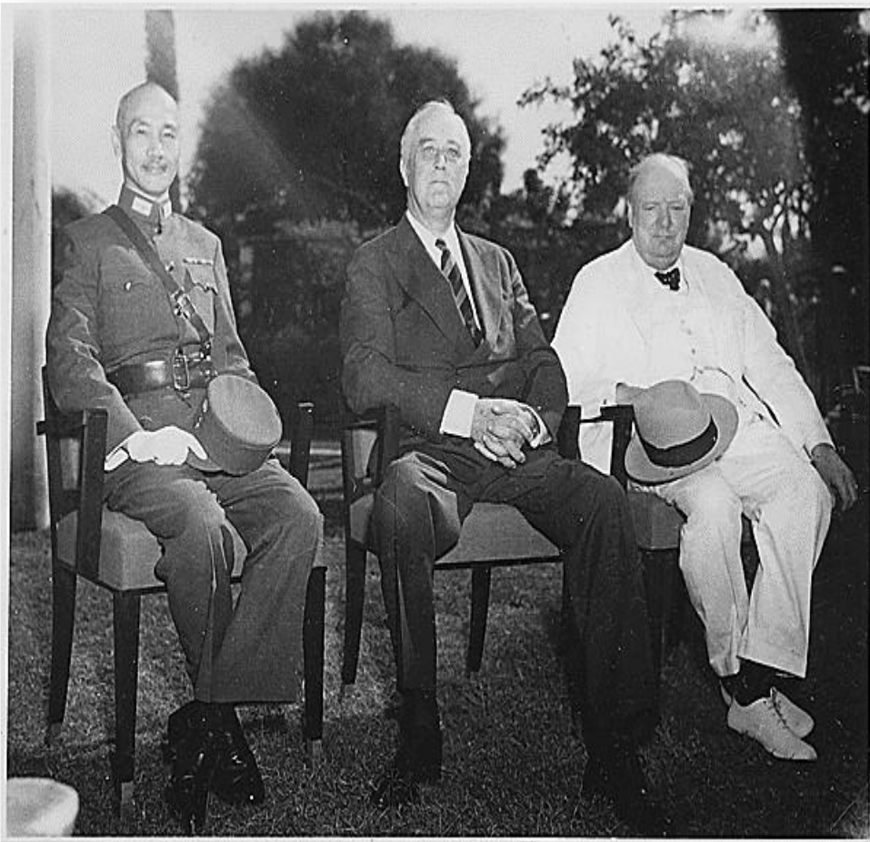
Каирская конференция 1943 г.

Разгром немцев под Сталинградом сорвал планы турецких реакционеров. С конца 1942 года турецкое правительство стало более тщательно скрывать свою помощь немцам. В начале 1943 года представители турецкого правительства встретились с Черчиллем в Адане, а в конце того же года – с Черчиллем и Рузвельтом в Каире. Турция начала получать вооружение от Англии и США. Не смотря на все это, в течение 1943 года Турция сохраняла доброжелательный к Германии нейтралитет и поставляла для неё очень необходимый для тяжелой промышленности хром, что раздражало союзников, требующих от Турции полного разрыва экономических и дипломатических взаимоотношений с Германией. Только в апреле 1944 года Турция под давлением союзников прекратила поставки хрома в Германию, а 2 августа объявила о разрыве экономических и дипломатических отношений с Германией.