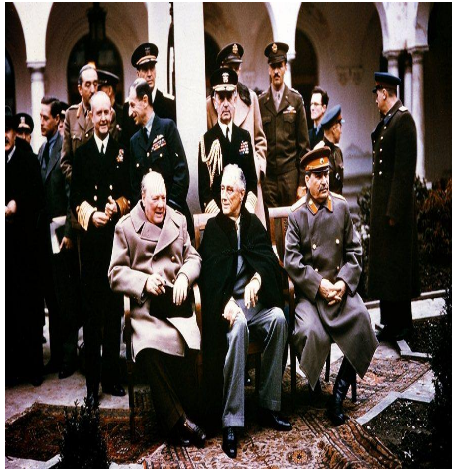
Ялтинская конференция 1945 г.

На Ялтинской конференции в феврале 1945 года Сталин выступил с особым заявлением по поводу Черноморских проливов, потребовав свободного прохода советских военных кораблей через проливы в любое время. Черчилль и Рузвельт согласились с подобными требованиями. Кроме того, на Ялтинской конференции было принято решение, что в создании Организации Объединённых Наций будут участвовать только те государства, которые объявят войну Германии до 1 марта 1945 года. После того, как об этом решении было поставлено в известность турецкое правительство, 23 февраля 1945 года оно формально объявило войну Германии, но в боевых действиях участия не принимало.