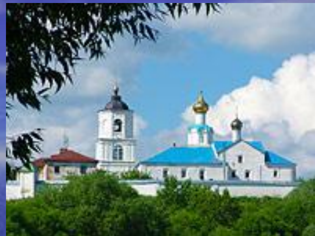
Васильевский мужской монастырь