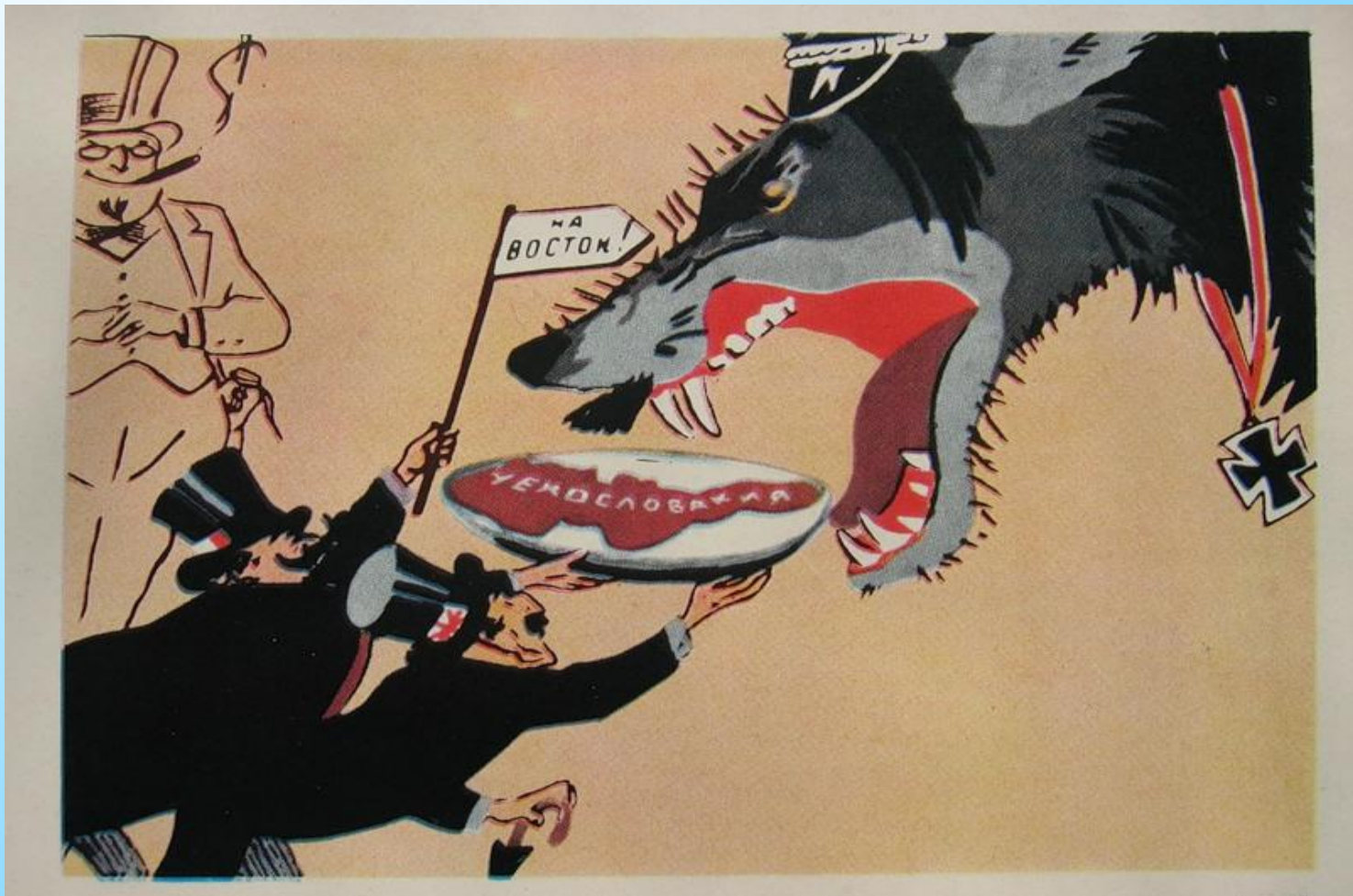
Мюнхенский сговор. Кукрыниксы.