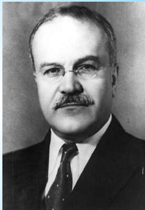
В.М.Молотов(Скрябин), С 1939 г.