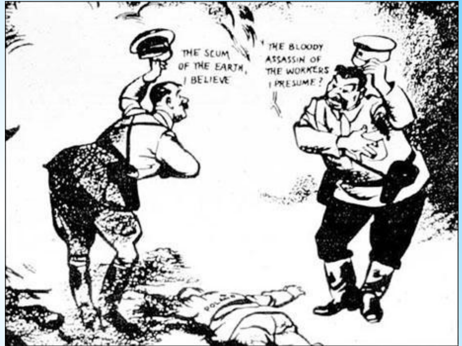
Танец у трупа Польши