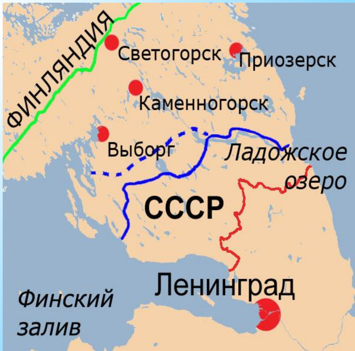
Карельский перешеек. Границы между СССР и Финляндией до и после Советско-финской войны 1939—1940 гг. «Линия Маннергейма»