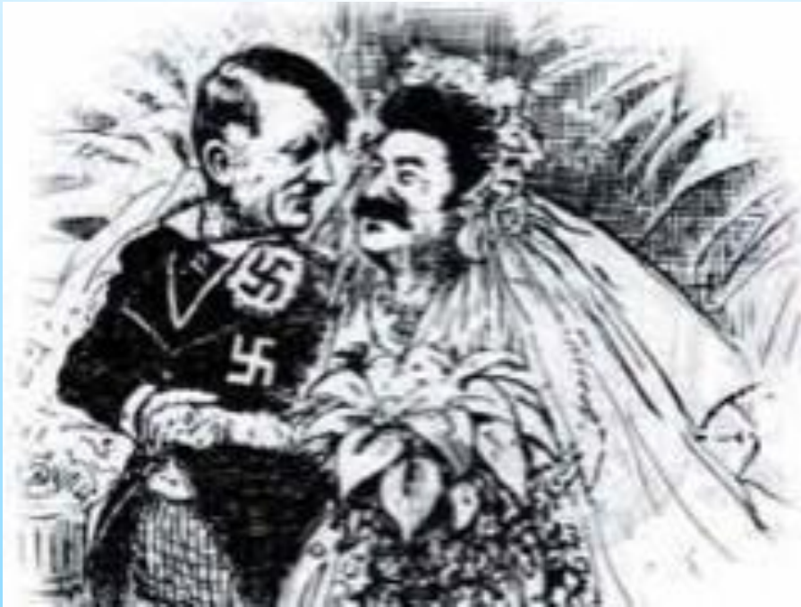
Брак по расчету