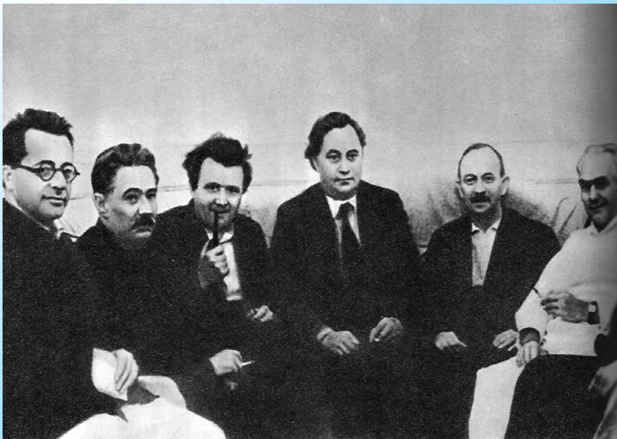
Секретариат ИККИ, избранный на VII конгрессе Коминтерна. Справа налево: В. Пик, О. Куусинен, Г. Димитров, К. Готвальд, Д. Манильский, П. Тольятти. 1935 год.