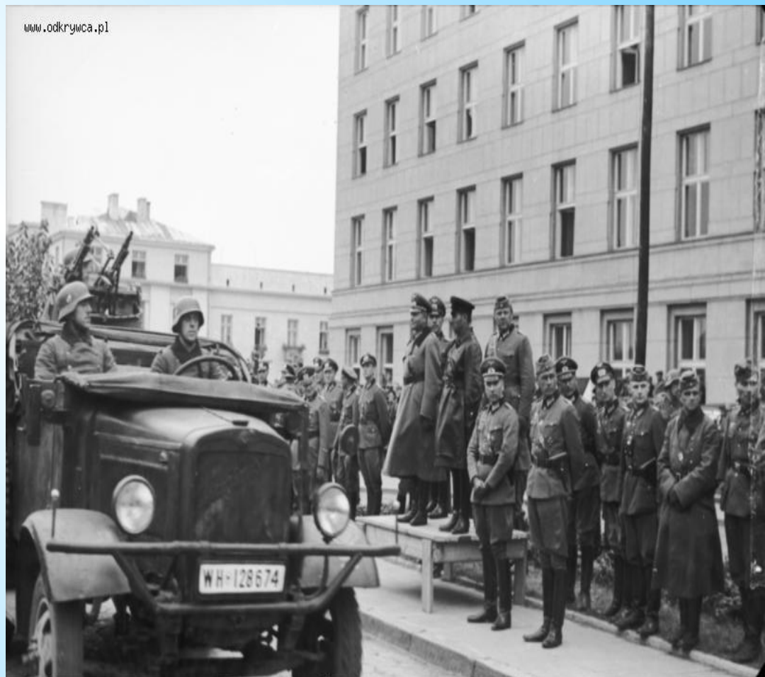
Bundesarchiv, Bild 101I-121-0011A-23 Foto: o. Ang. | 22. September 1939

Гудериан (в центре) и Семён Кривошеин (справа).