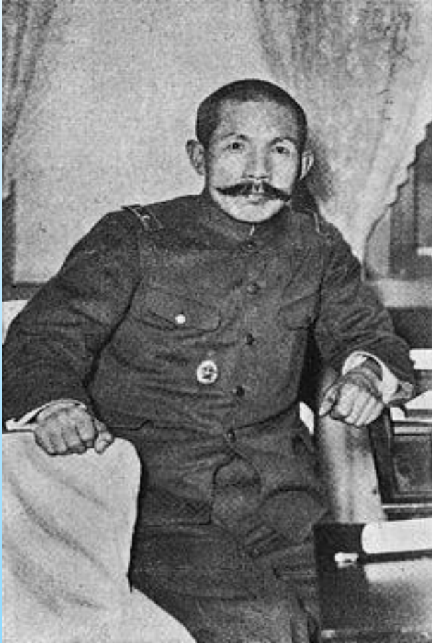
Садао Араки, военный министр Японии в 1931-1936 гг.