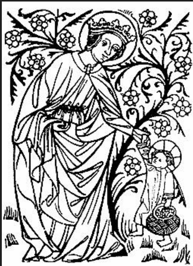
Св. Доротея. Ксилография начала XVI в