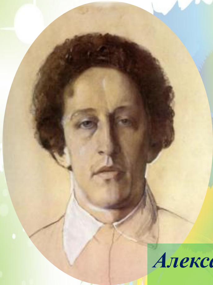
Александр Александрович Блок