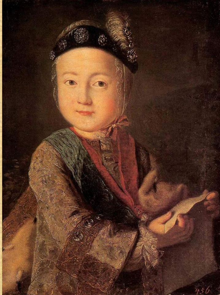
Павел I в детстве