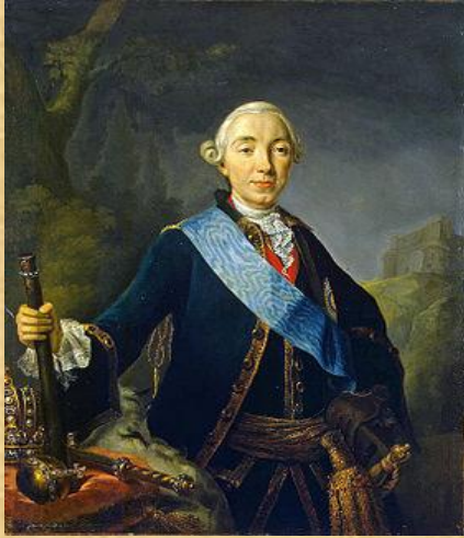
Петр III – отец Павла I

Павел I- сын Петра III и Екатерины II. Родился 20 сентября (1 октября) 1754 г.