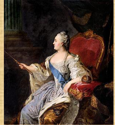
Екатерина II- мать Павла I