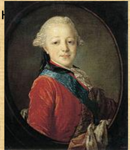
Павел I в 7 лет

Павел I изучал историю, математику, иностранные языки, географию.