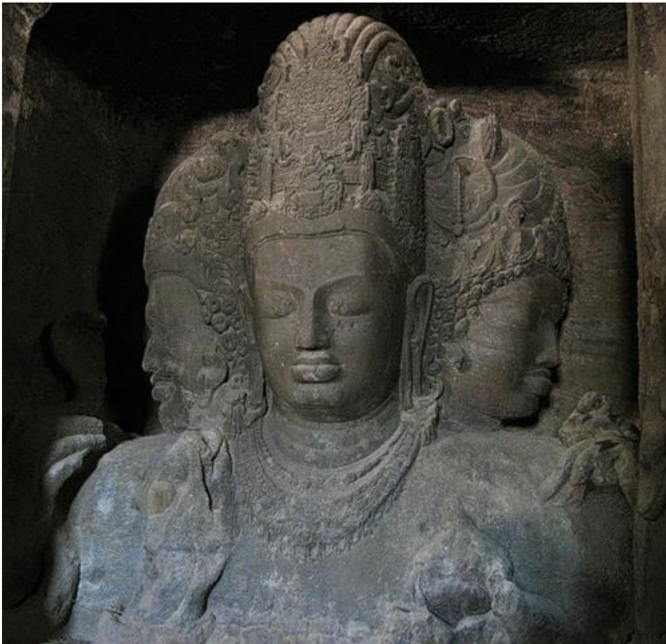
Бюст трёхликого Шивы