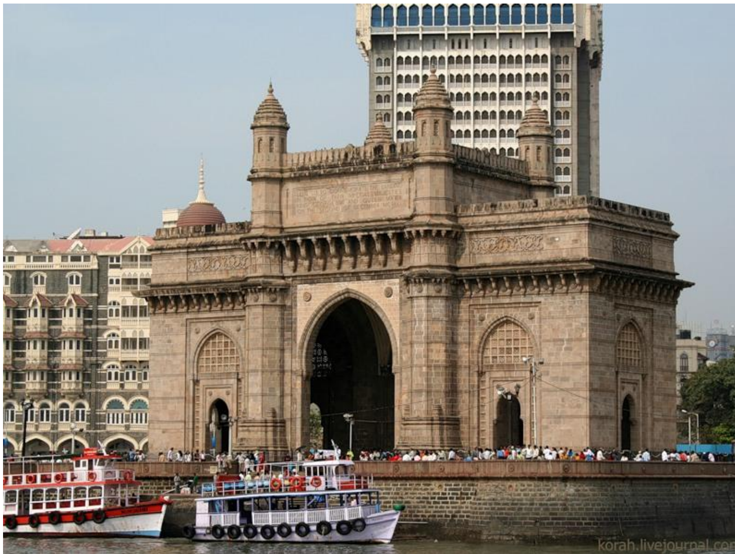
«Ворота в Индию»