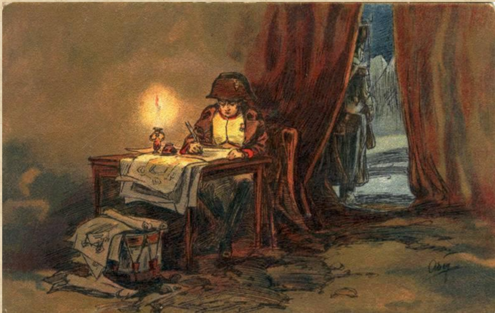
Наполеон пишет диспозицию Бородинского сражения.