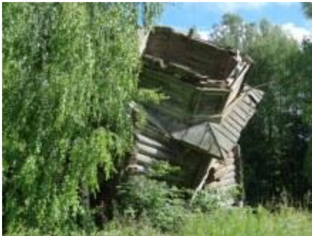
Старая церковь в Круг-Мазарах (до деревни Ошедские 1,3 км)