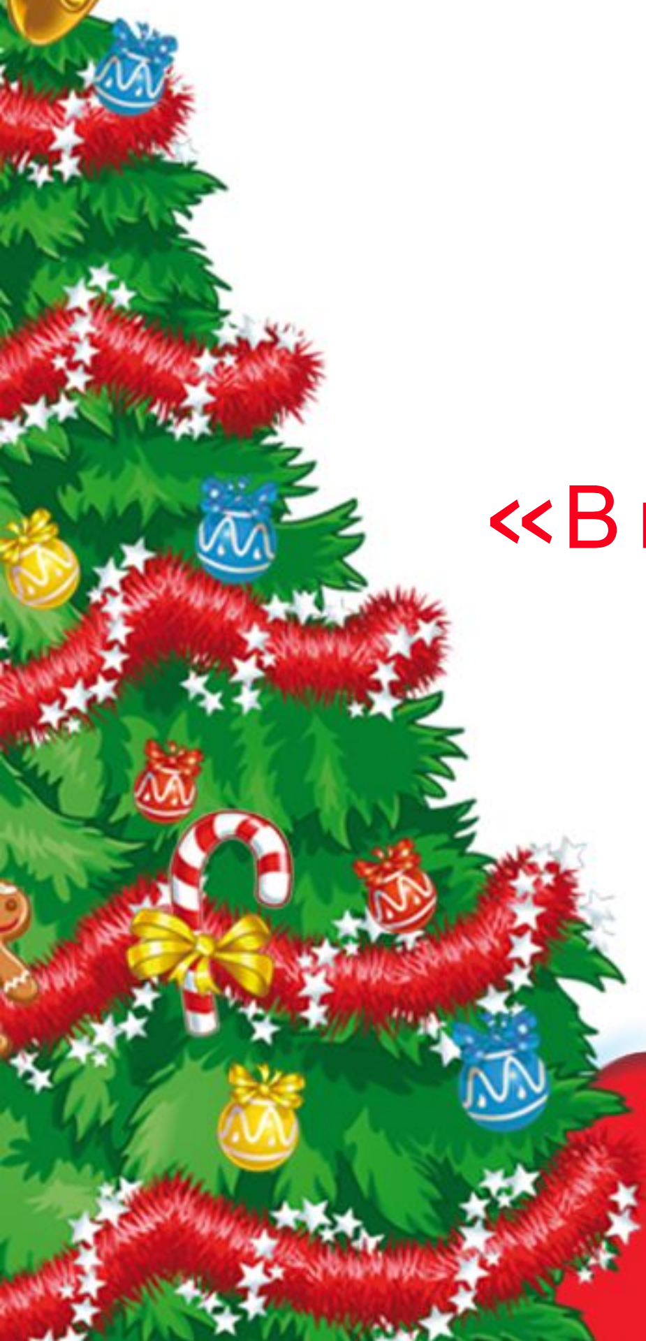
Фото-зона «В гостях у Деда Мороза вместе с Kinder»