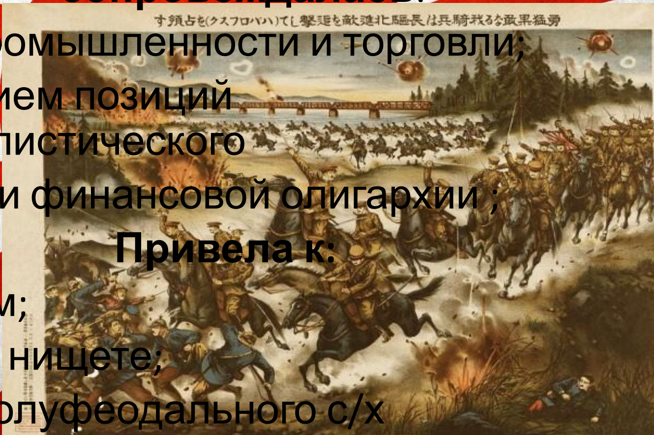
THE ILLUSTRATION OF THE SIBIRIAN WAR, 1907

бедствиям; растущей нищете; кризису полуфеодального с/х