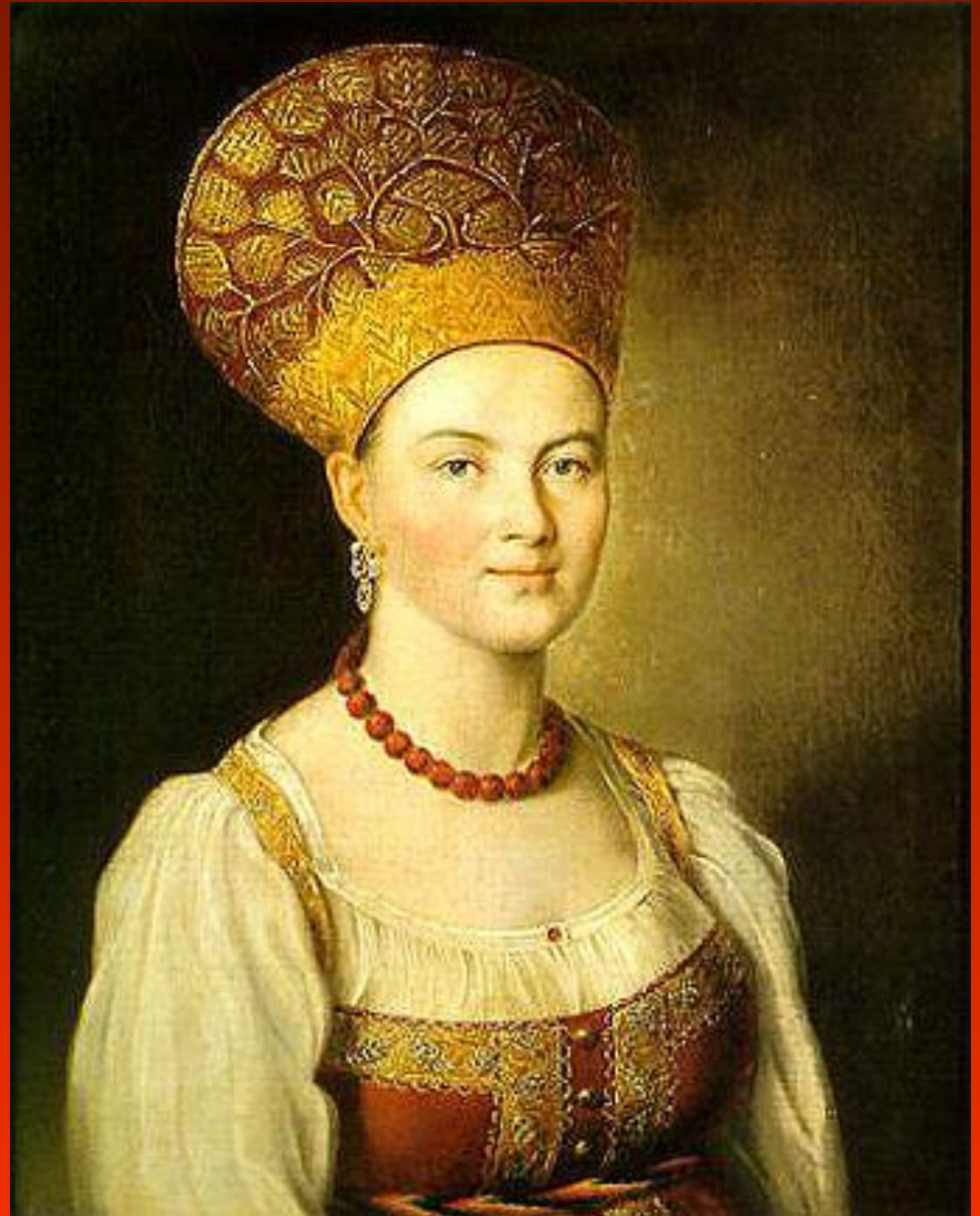
И.Аргунов. Портрет неизвестной крестьянки в русском costume.

Большое значение придавали лицу как выражению души и характера. Заглянуть в лицо человека — значит заглянуть в его душу.