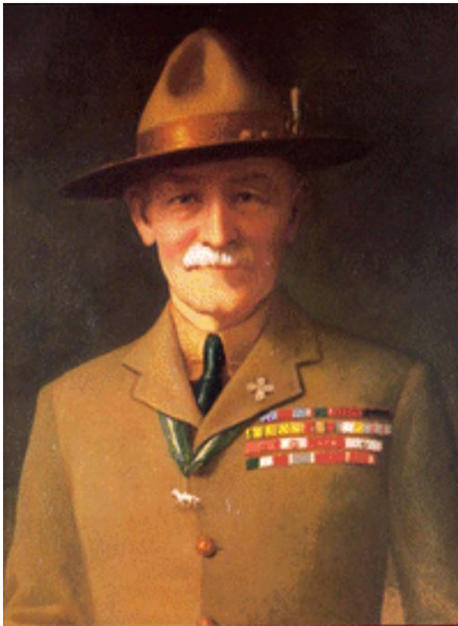
Роберт Баден-Пауэлл (1857 — 1941).