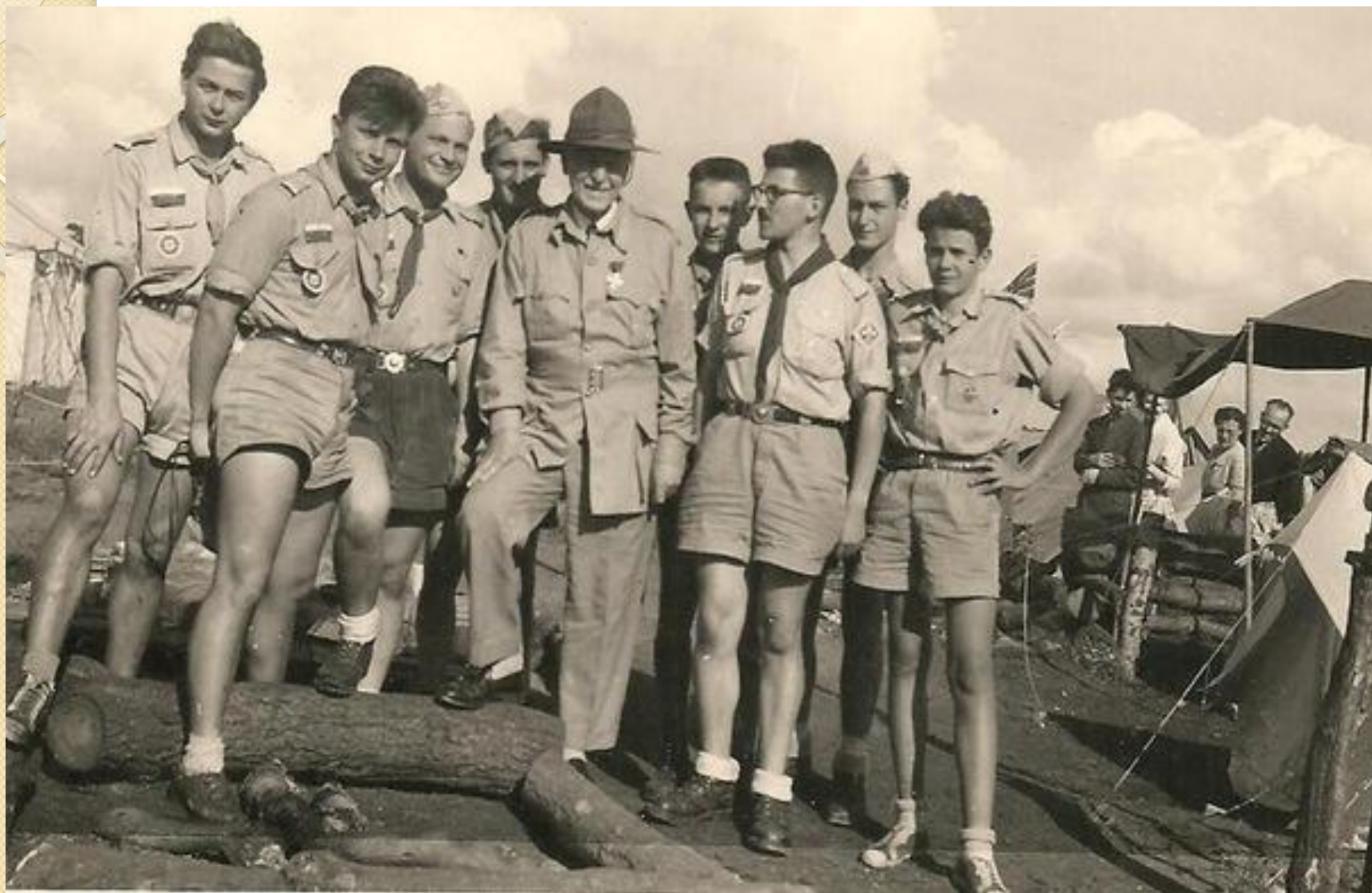
Олег Иванович Пантюхов (1882 — 1973) с отрядом российских скаутов.