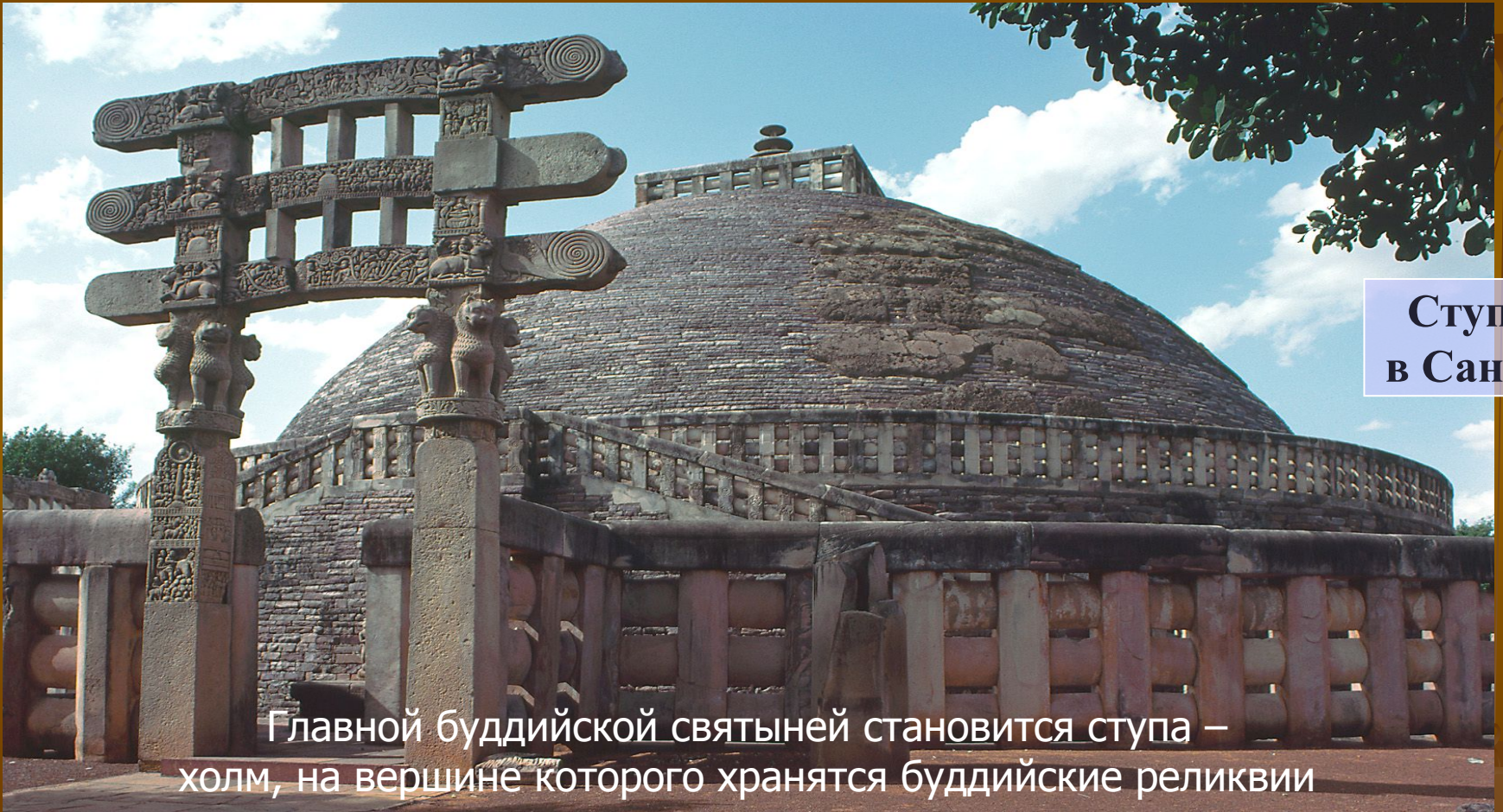
Ступа в Санчи

Главной буддийской святыней становится ступа – холм, на вершине которого хранятся буддийские реликвии