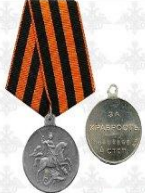
Отечественная война I степени с Звездой (Время правления)