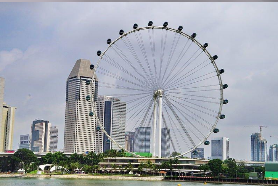
Сингапурское колесо обозрения