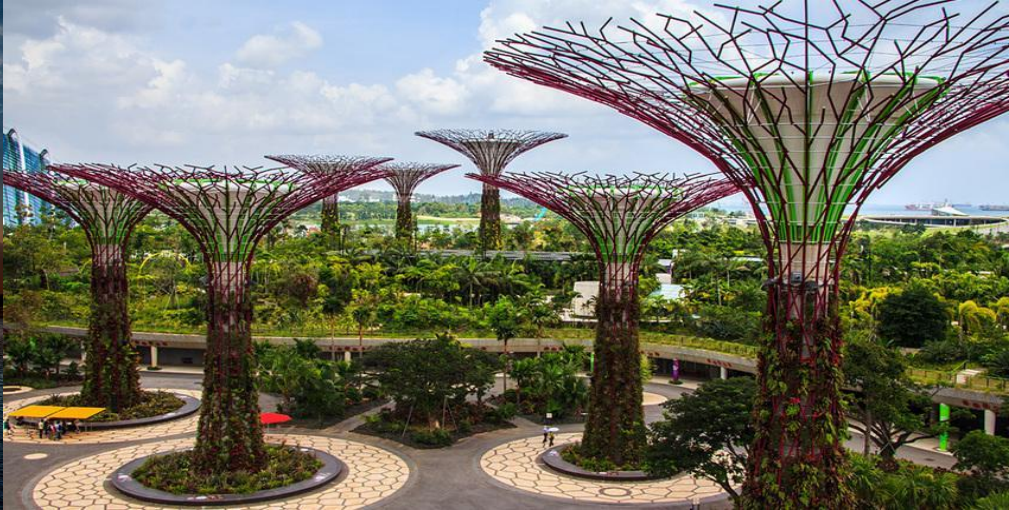
Сады у Залива