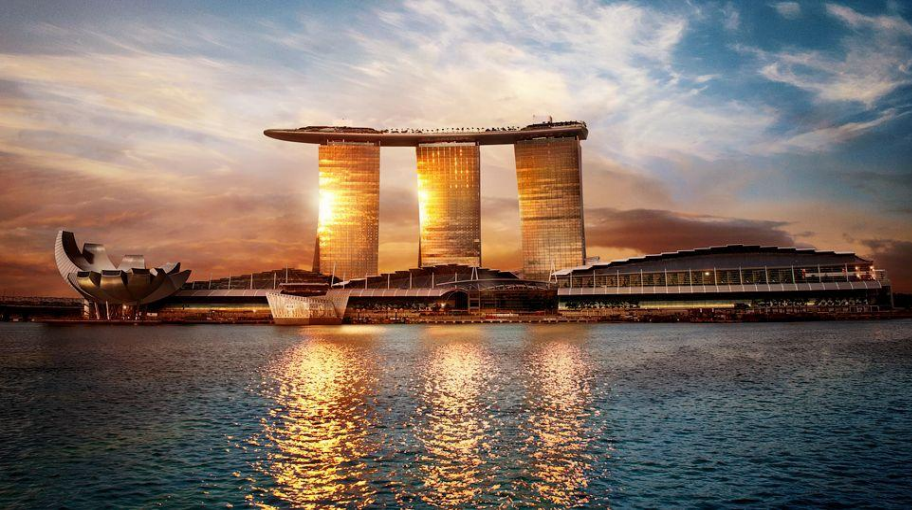
Отель Marina Bay Sands