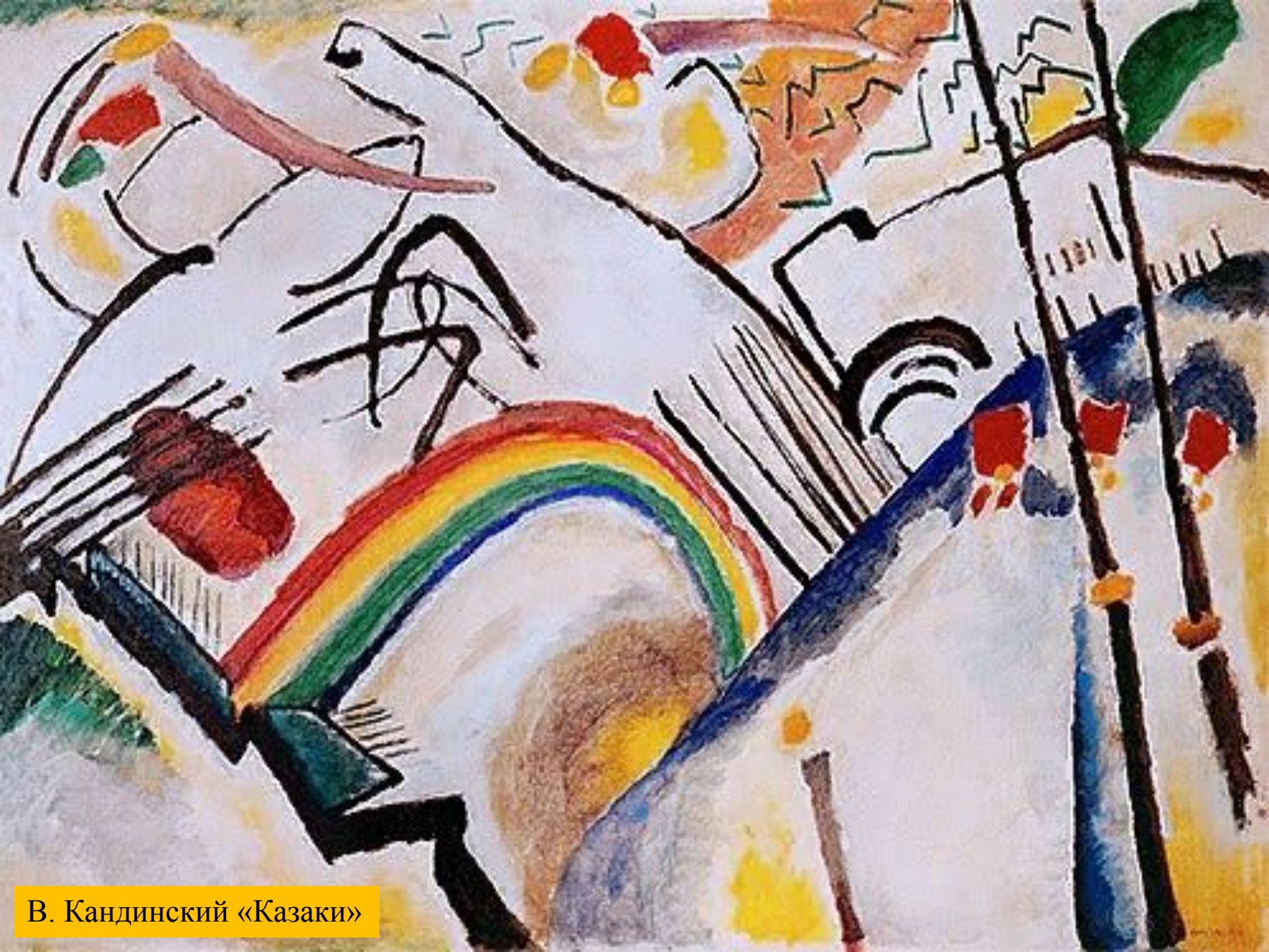
В. Кандинский «Казак»