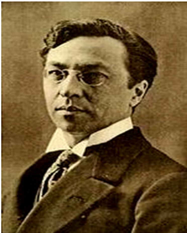
Василий Кандинский 1866-1944

Русский живописец и график, один из основоположников и теоретиков абстрактного искусства, автор экспрессивных, динамичных композиций, построенных на сочетании красочных пятен и ломаных линий