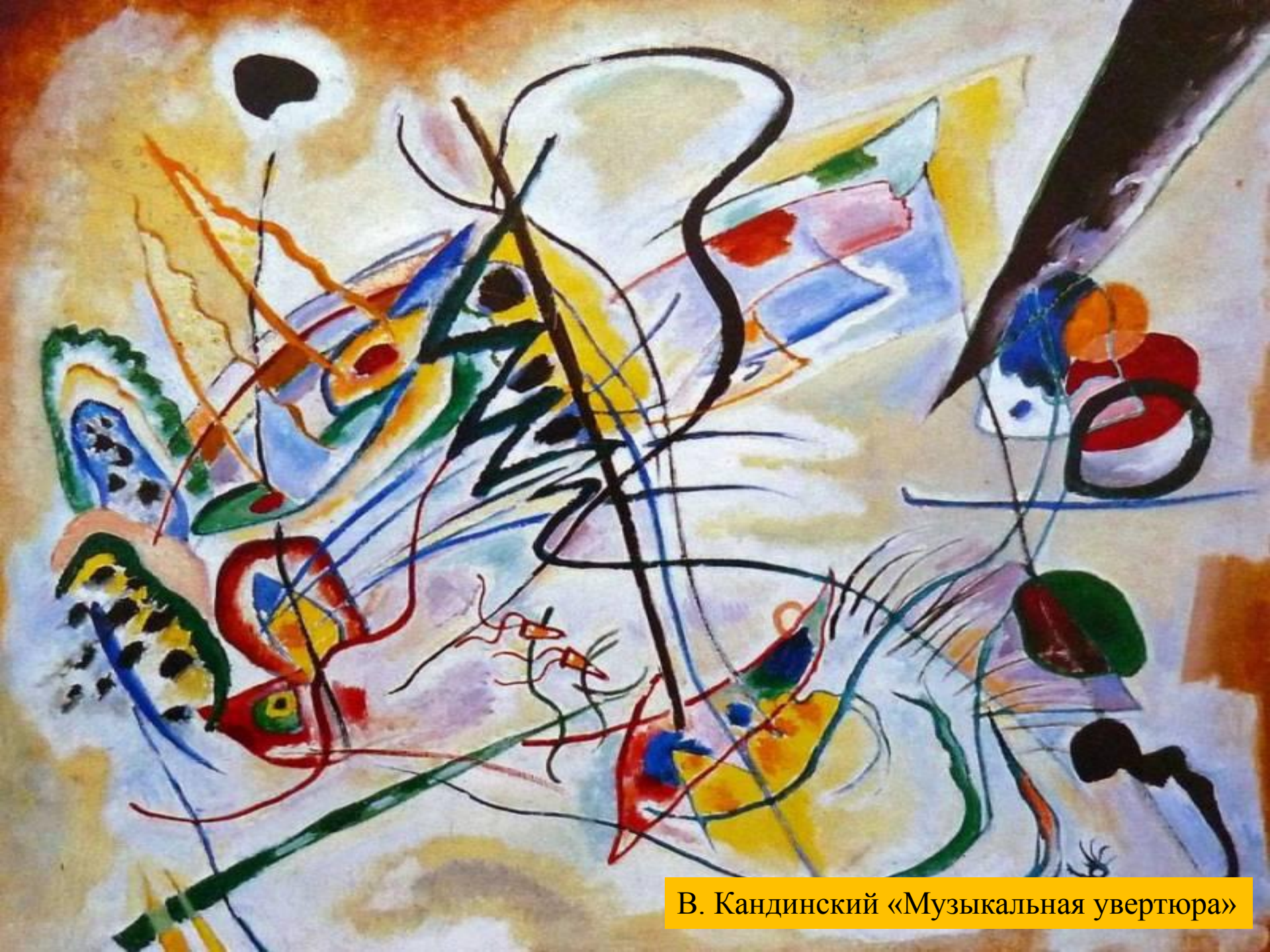
В. Кандинский «Музыкальная увертюра»