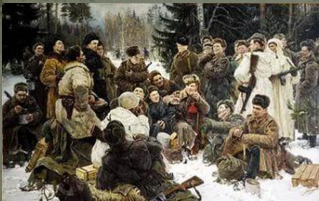
Ю. Непринцев. Отдых после боя.