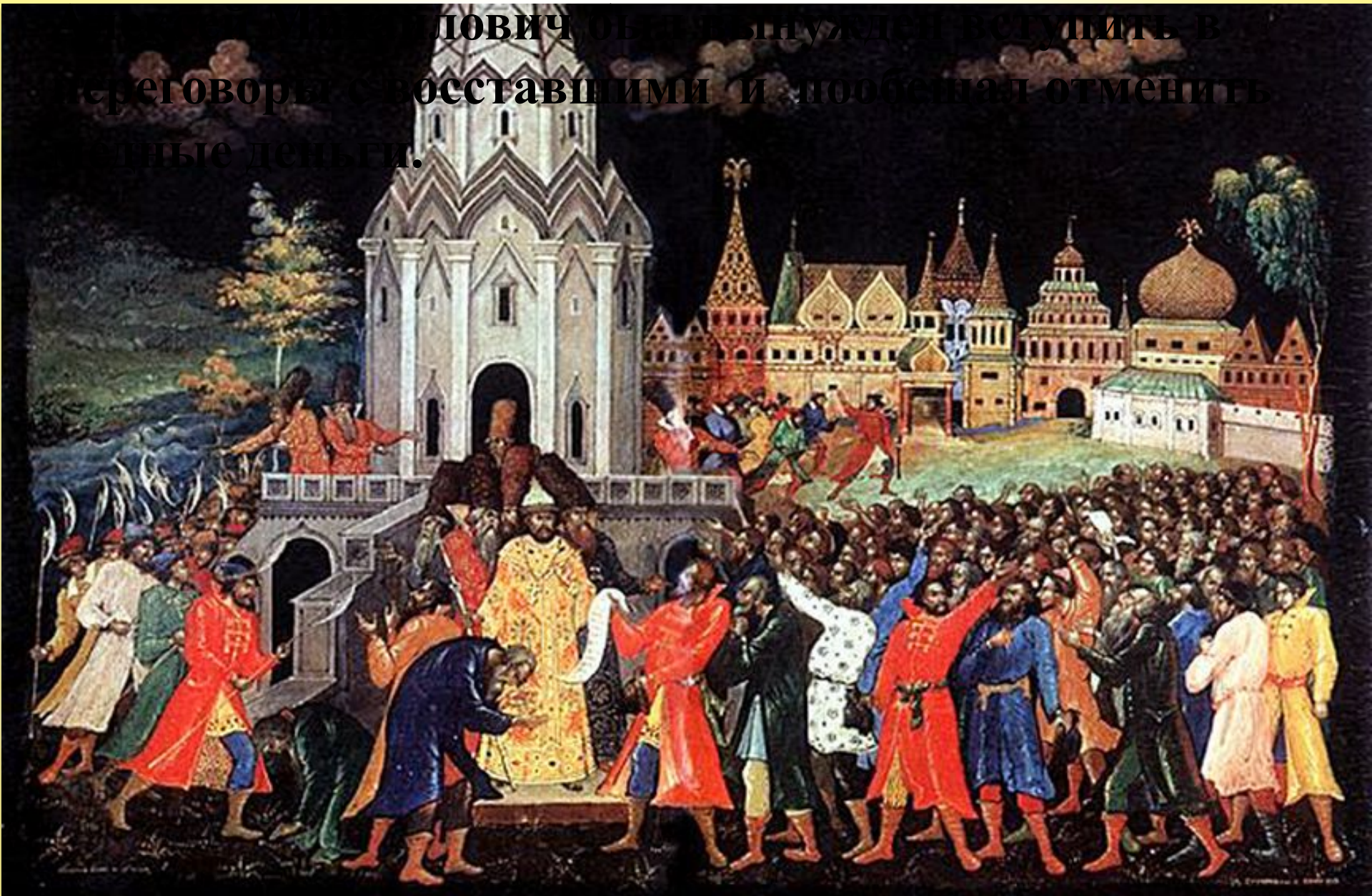
Буторин Д.Н. Медный бунт. Палех

ЛОВИЧ ОЕ ПРНУЖДЕНО СЛУШИТЬ В ереговоре оставшими и побуждал отменить ные деньги.