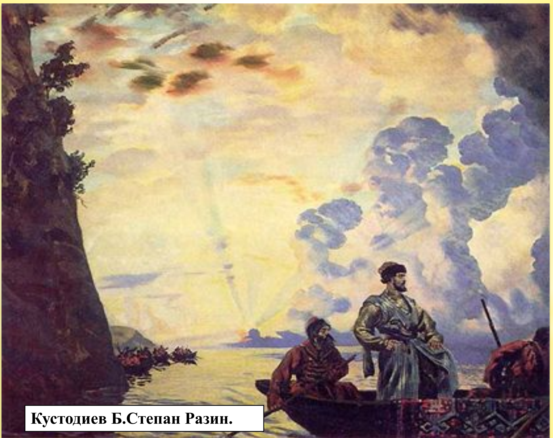
Кустодиев Б. Степан Разин.