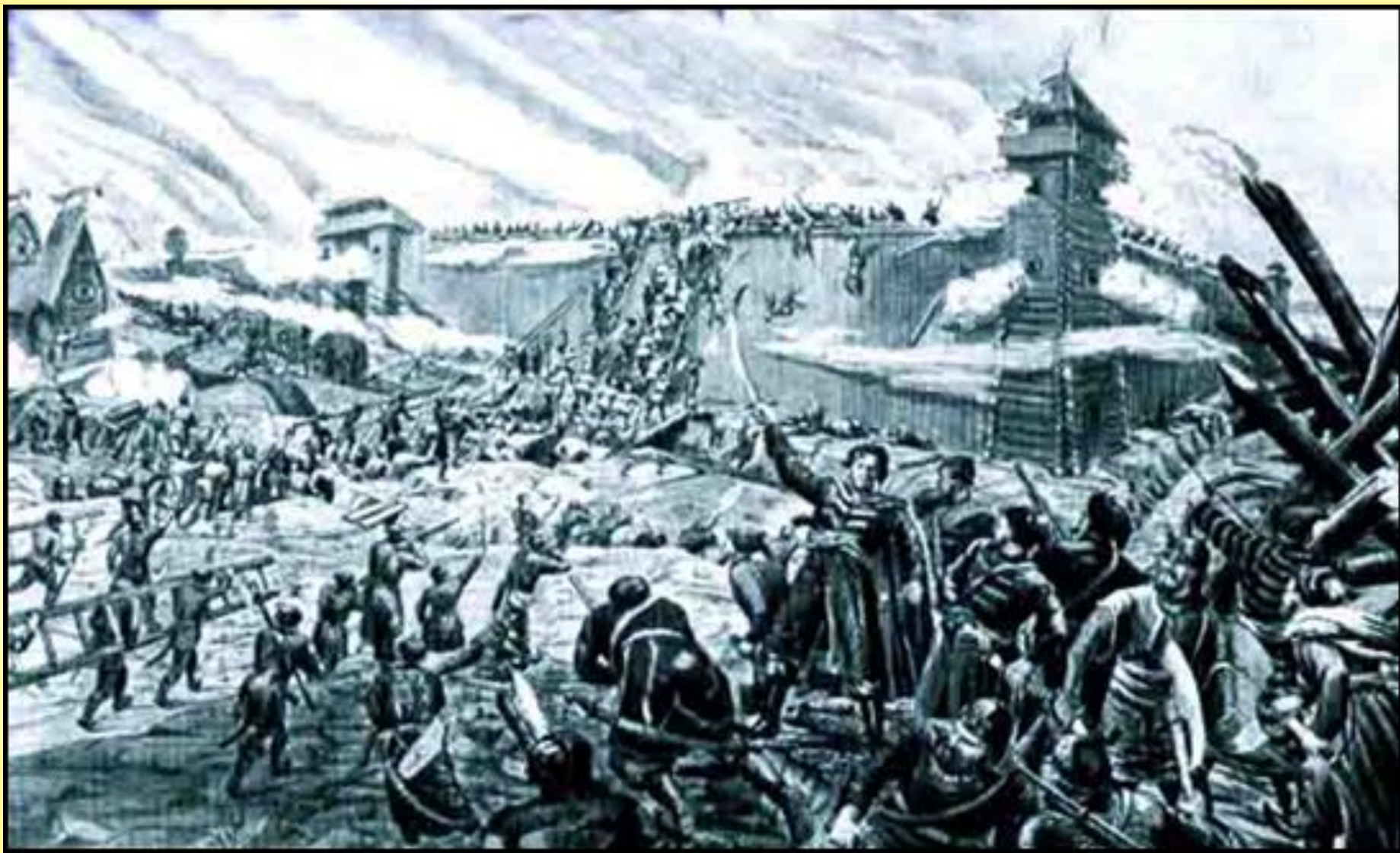
Войска Степана Разина штурмуют Симбирск. Иллюстрация.