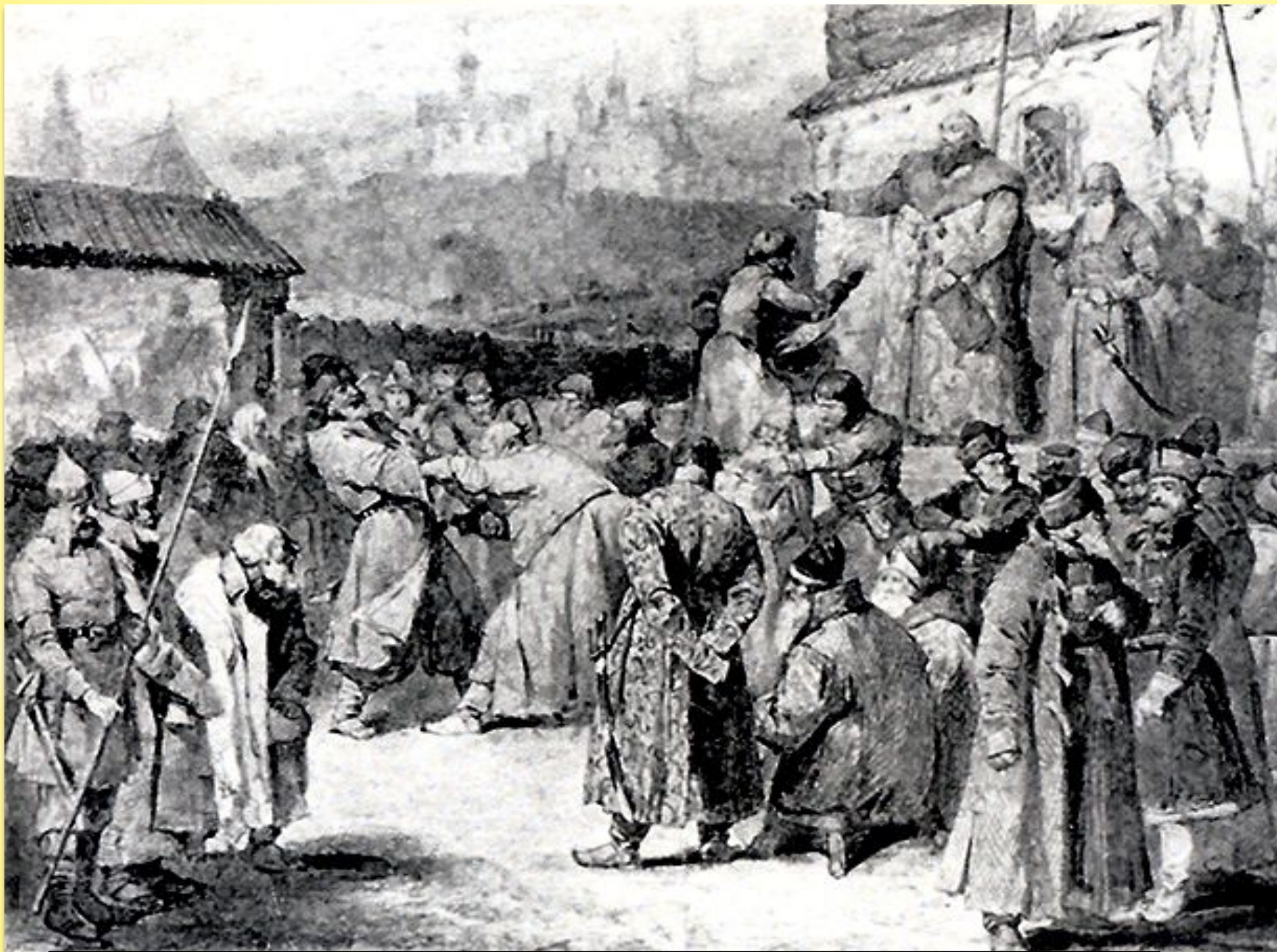
Васнецов В. Царь Алексей Михайлович в селе Коломенском