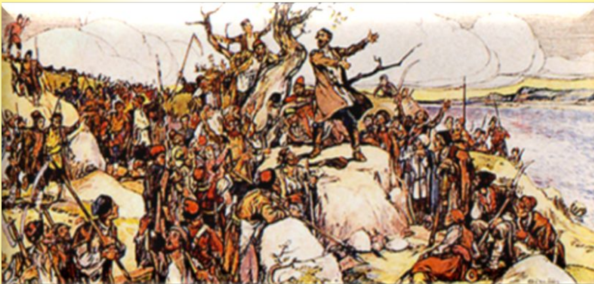
Апсит А. Призыв Разина