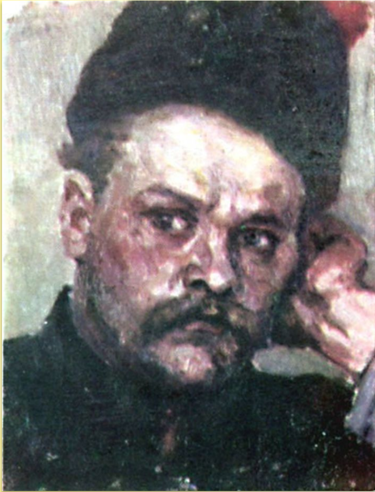
Суриков В. Степан Разин

Степана Тимофеевича Разина. 1667 – 1671гг.