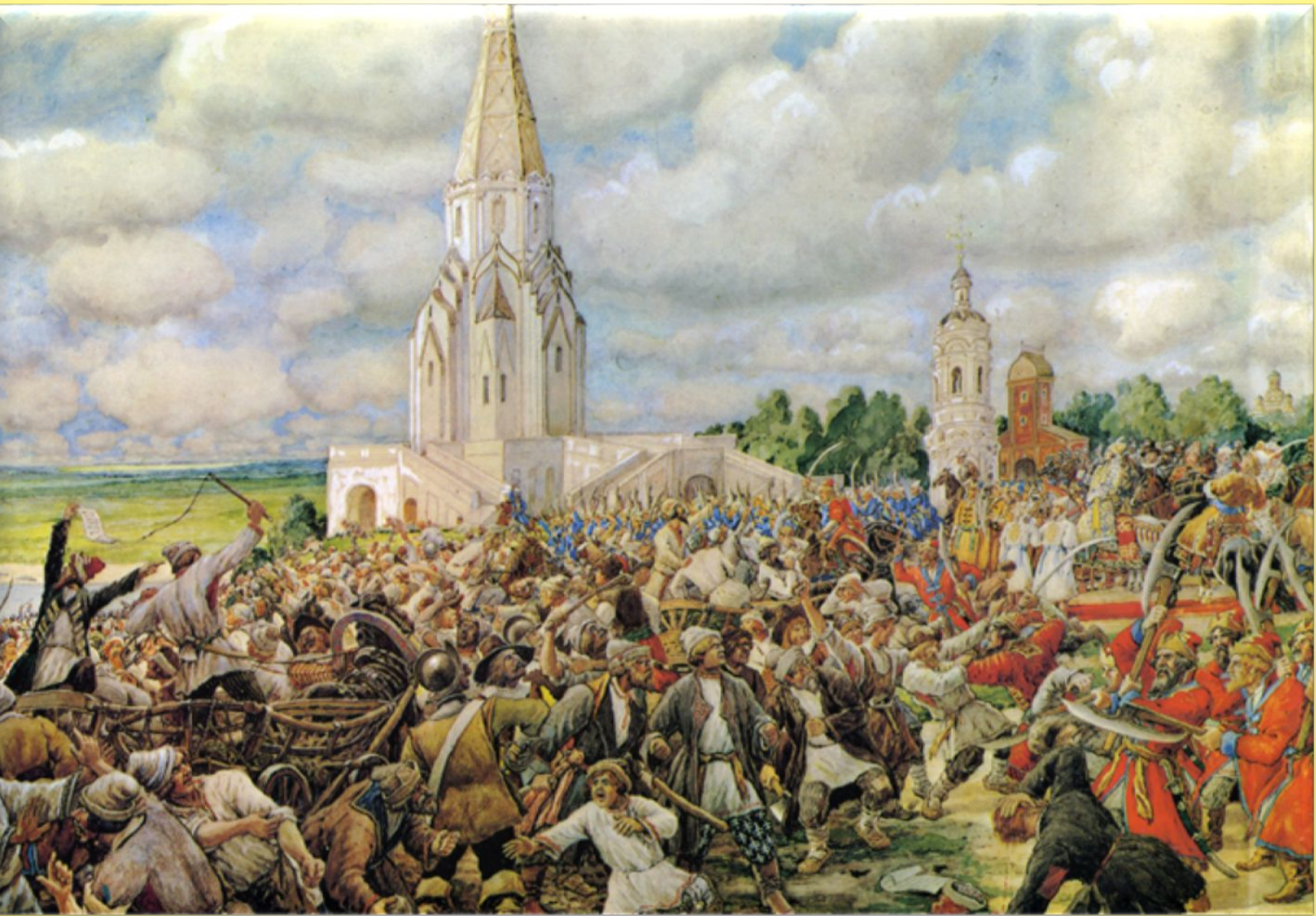
Лиснер Э. Медный бунт 1662г.