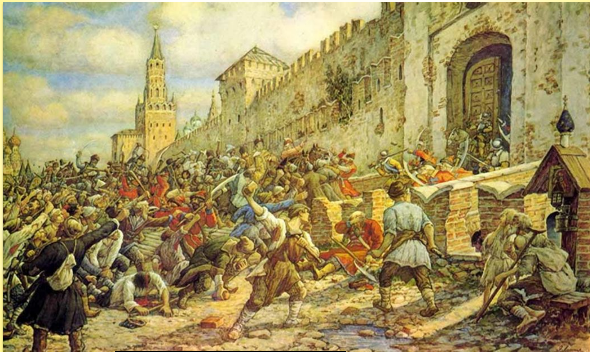
Лиснер Э. Соляной бунт.