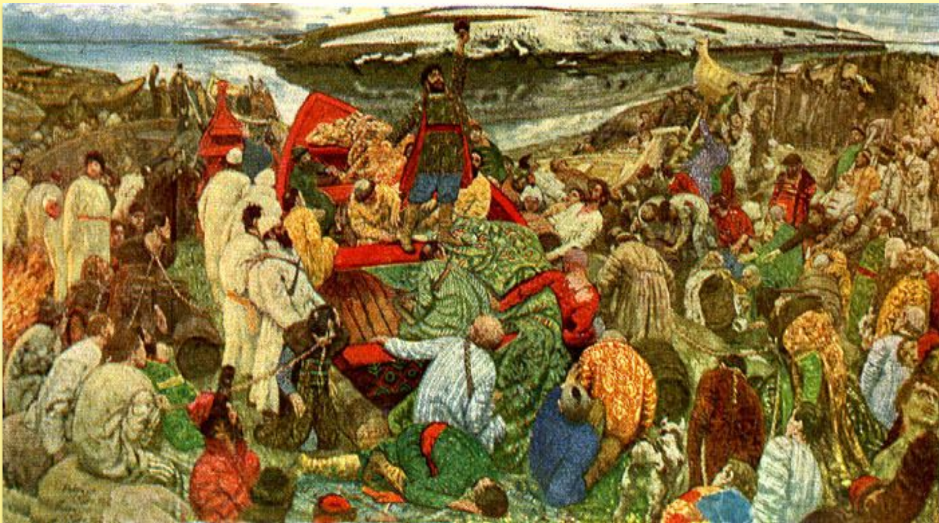
Горелов Г. Степан Разин на Волге