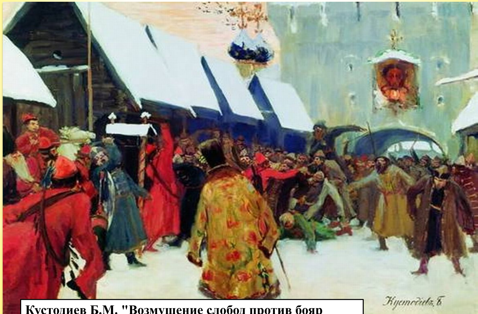
Кустодиев Б.М. "Возмущение слобод против бояр"