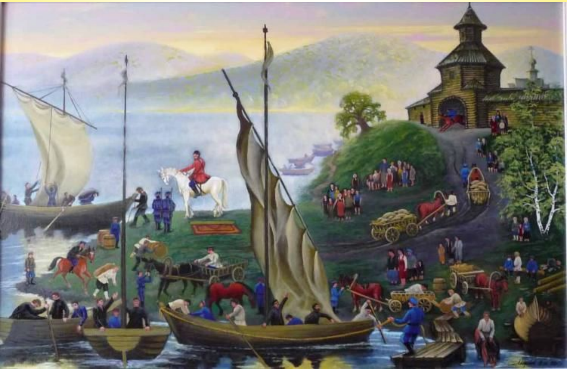
Марков В. Разин-благотетель.