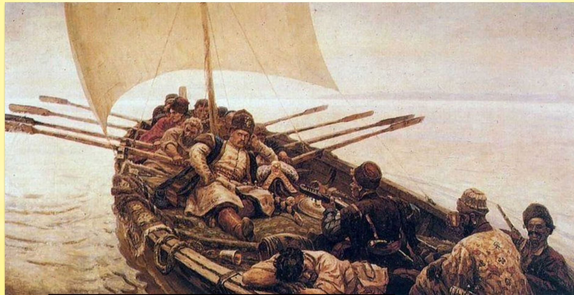
Суриков В. Степан Разин.