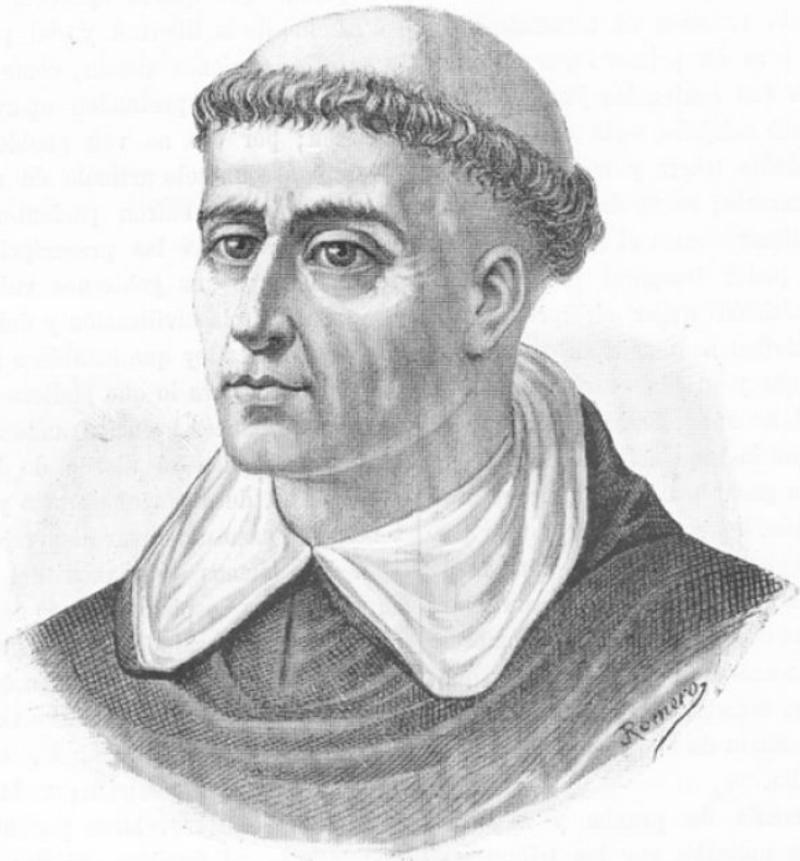
Томас Торквемада – глава испанской инквизиции