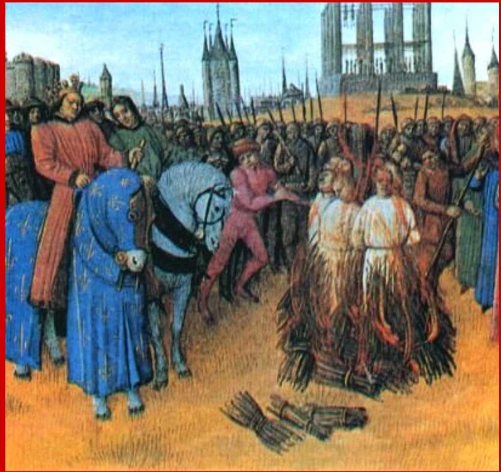
Аутодафе («дело веры») - сожжение еретиков.