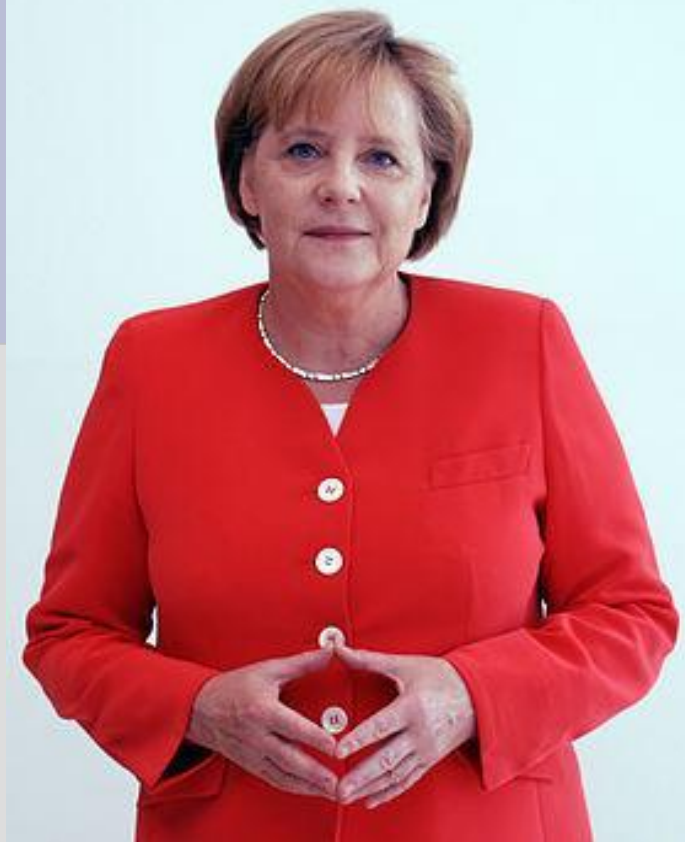
Ангела Меркель – федеральный канцлер Германии

По государственному устройству является федеративным государством, подразделяющимся на 16 административно-территориальных единиц — федеральных земель. Форма государственного правления в Германии — парламентская республика.