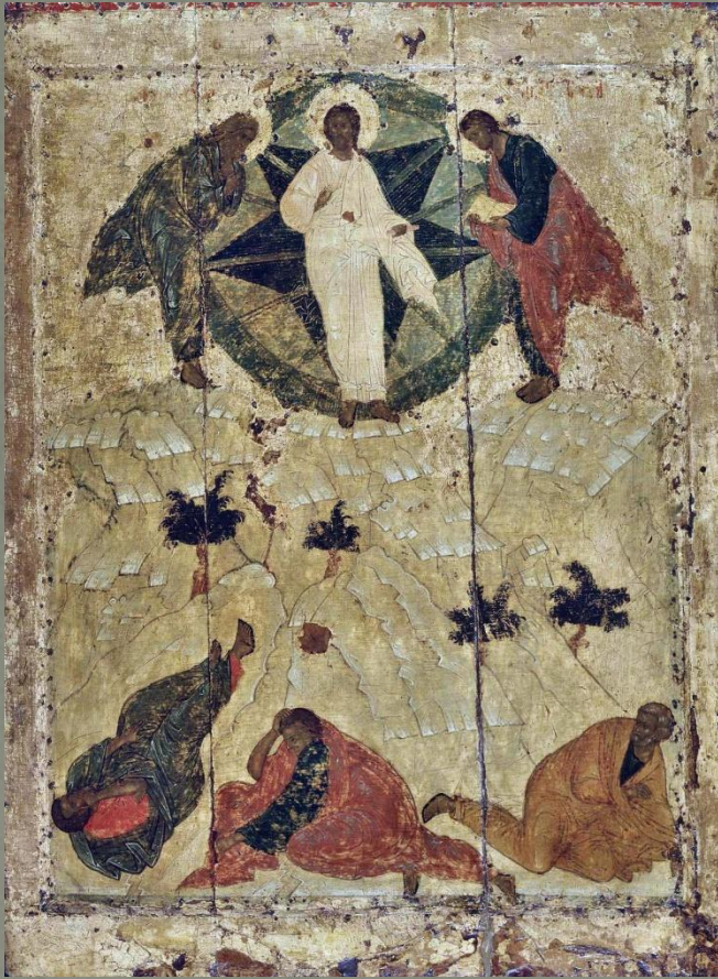
Андрей Рублёв. "Преображение Господне". Благовещенский собор Московского Кремля