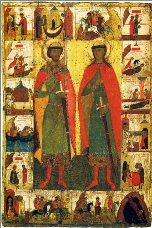
«Борис и Глеб с житием»,