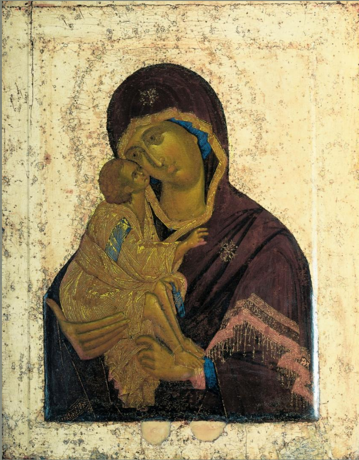
Богоматерь Донская. Икона. XIV в.