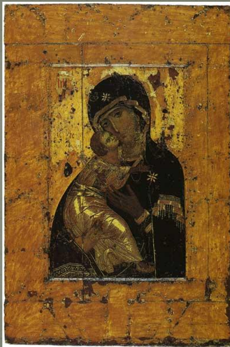
Богоматерь Владимирская Двухсторонняя икона Школа или худ. центр: Византия Первая треть XII в.