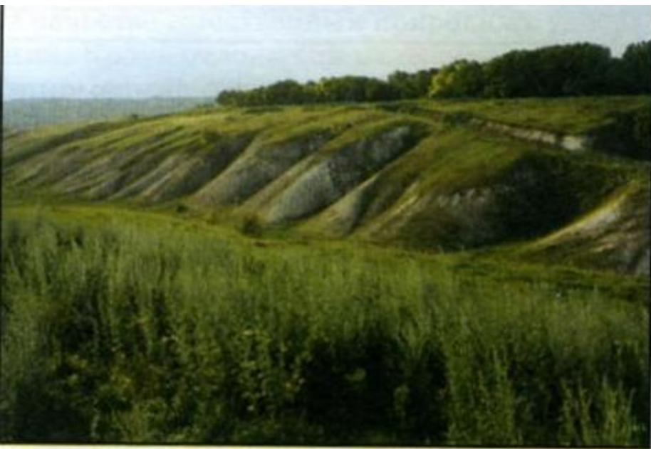
Овражно-балочное расчленение в бассейне р. Короча