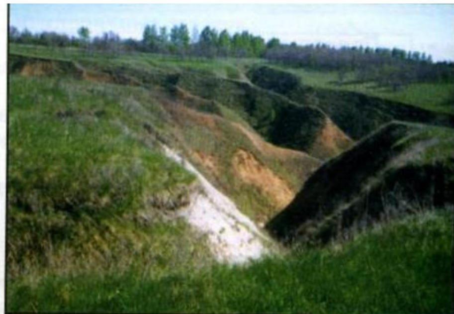
Бассейн р. Котел (эрозионный склон)