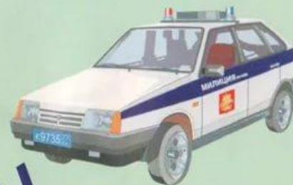
Специальные автомашины с громкоговорящей связью