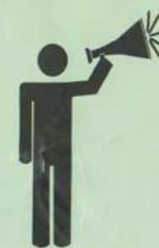
Иные доступные способы

Услышав звуковой сигнал сирены, который означает «ВНИМАНИЕ ВСЕМ!!!» , необходимо срочно найти возможность доступа к любым средствам массовой информации. ВНИМАТЕЛЬНО прослушать сообщение и действовать в соответствии с передаваемыми указаниями.