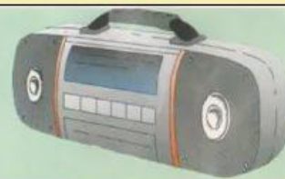
Радиоприемник (частота 70,94МГц)