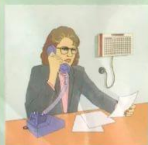
Радио (любая проводная радиоточка)