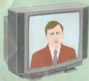
Телевизионный канал «Подмосковье»