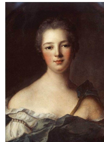
Жанна-Антуанетта Пуассон (маркиза Помпадур)