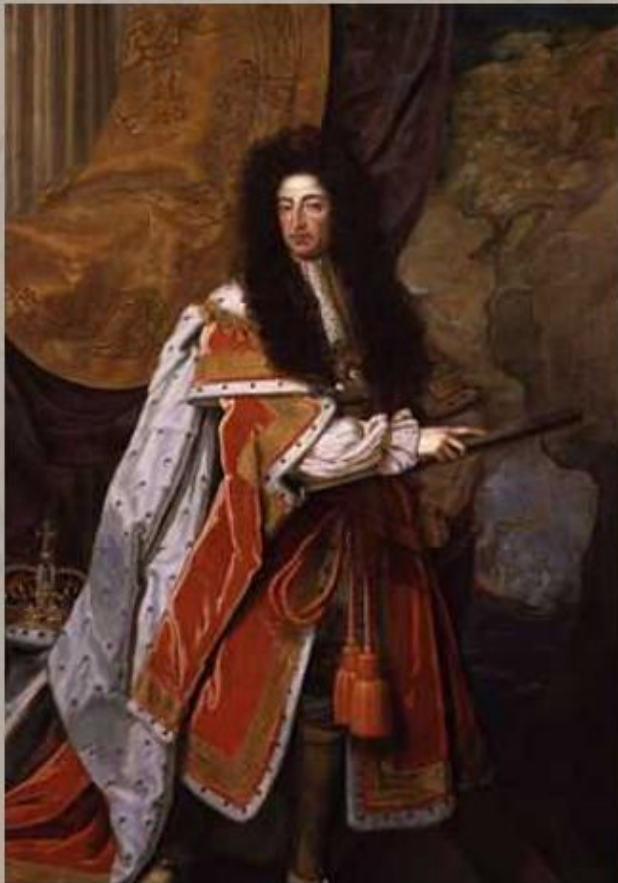
Вильгельм III Оранский (1650-1702)

1688 год – «Славная революция»: парламент пригласил на трон Вильгельма III Оранского