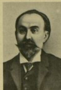
Г. В. ПЛЕХАНОВ