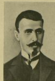
И. Г. ЦЕРЕТЕЛИ