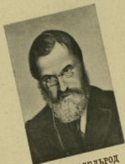
П. Б. АКСЕЛЬРОД