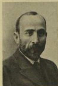
Н. С. ЧХЕИДЗЕ