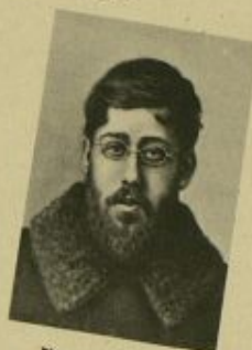
Ю. О. МАРТОВ