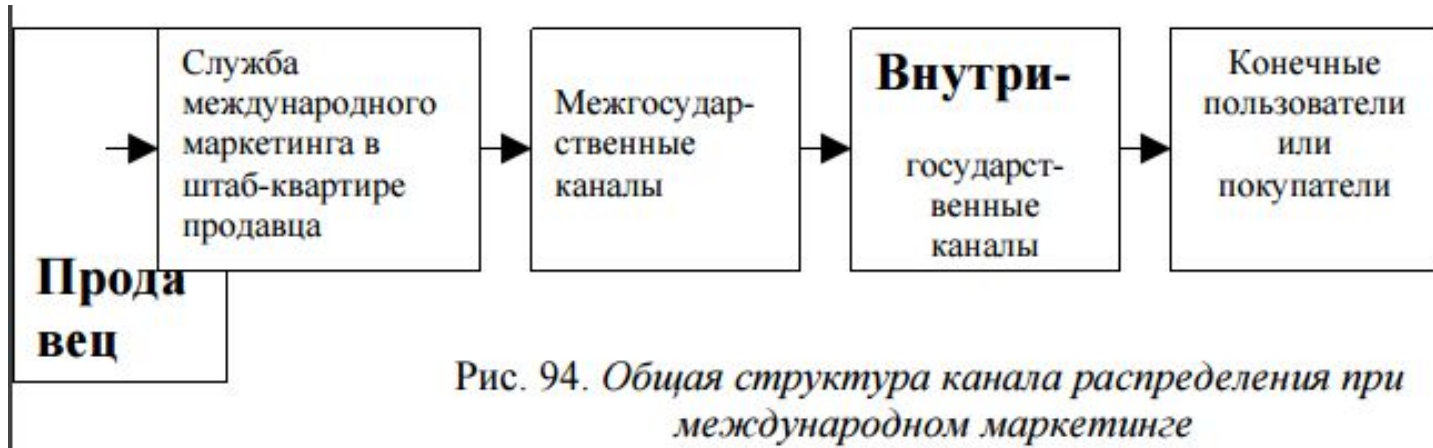
Рис. 94. Общая структура канала распределения при международном маркетинге

Фирма, выступающая на международном рынке, должна обязательно комплексно рассматривать проблемы доведения своих товаров до конечных потребителей.