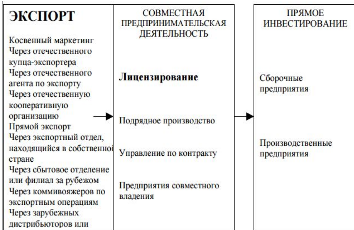
Рис. 92. Стратегии выхода на зарубежный рынок