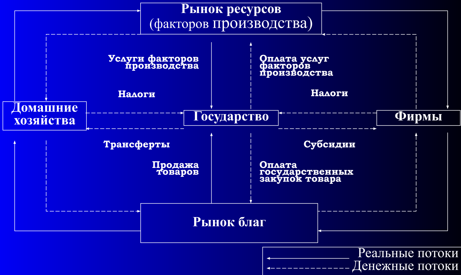
Рис. 2.1.б. Модель экономического кругооборота