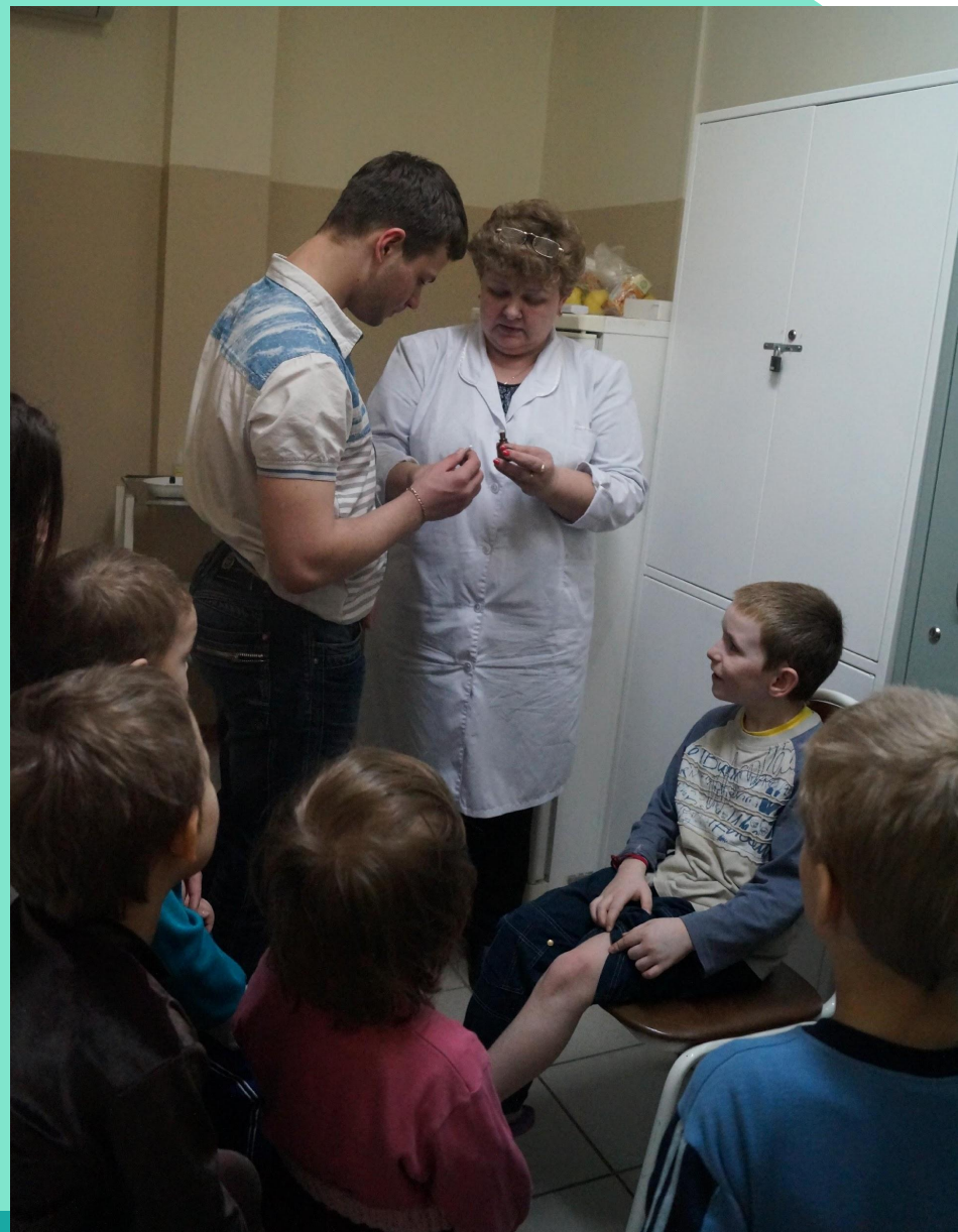
Станция «Скорая помощь»