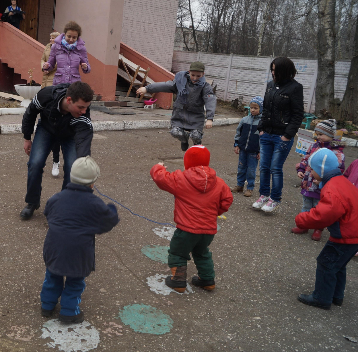
Игра «Ловись, рыбка»