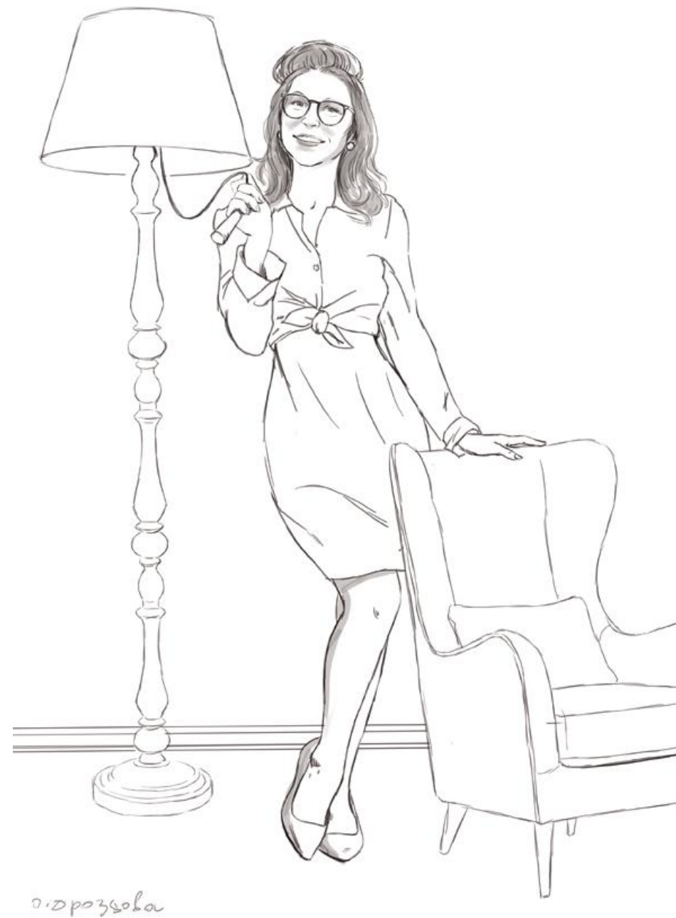
Изумрудная рубашка, молочная (шелковая) юбка, бежевые туфли. Песочный абажур, торшер деревянный