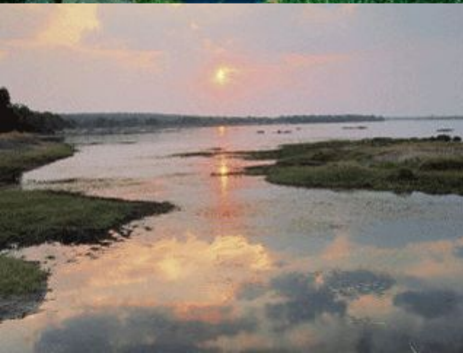
Реки: Нил, Конго