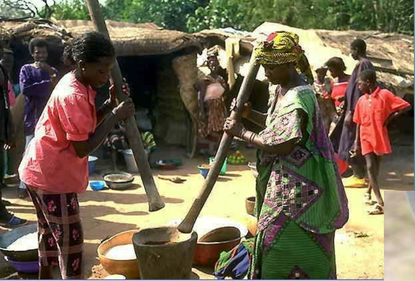
В африканской деревне.