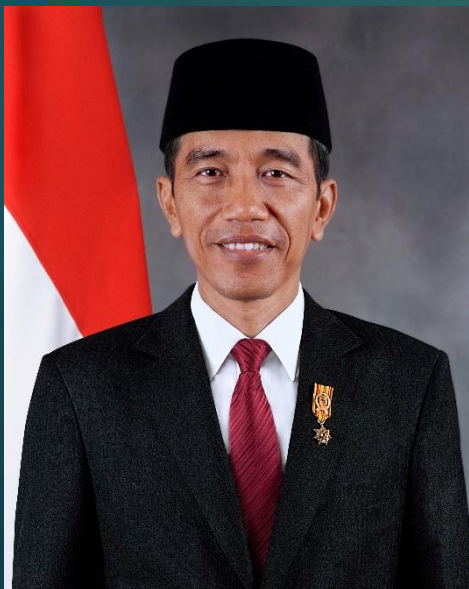
Джоко Видодо, нынешний президент Индонезии (2014 – н.в.)