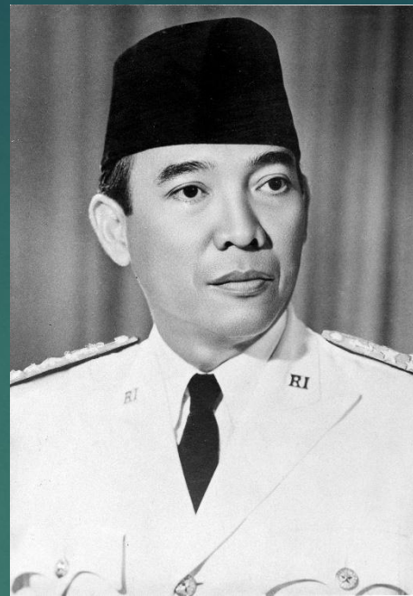
Сукарно, первый президент Индонезии (1945 - 1967)