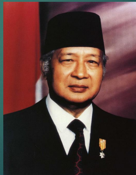
Хаджи Мухаммед Сухарто