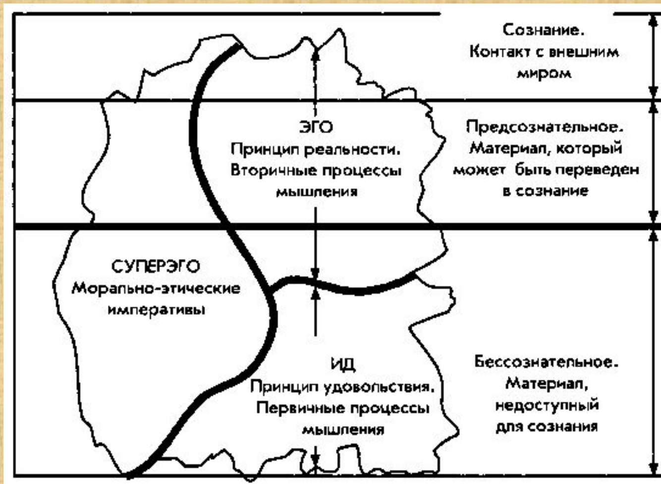
Рис. 1. Связь структурной модели психики с уровнями сознания. З.Фрейд