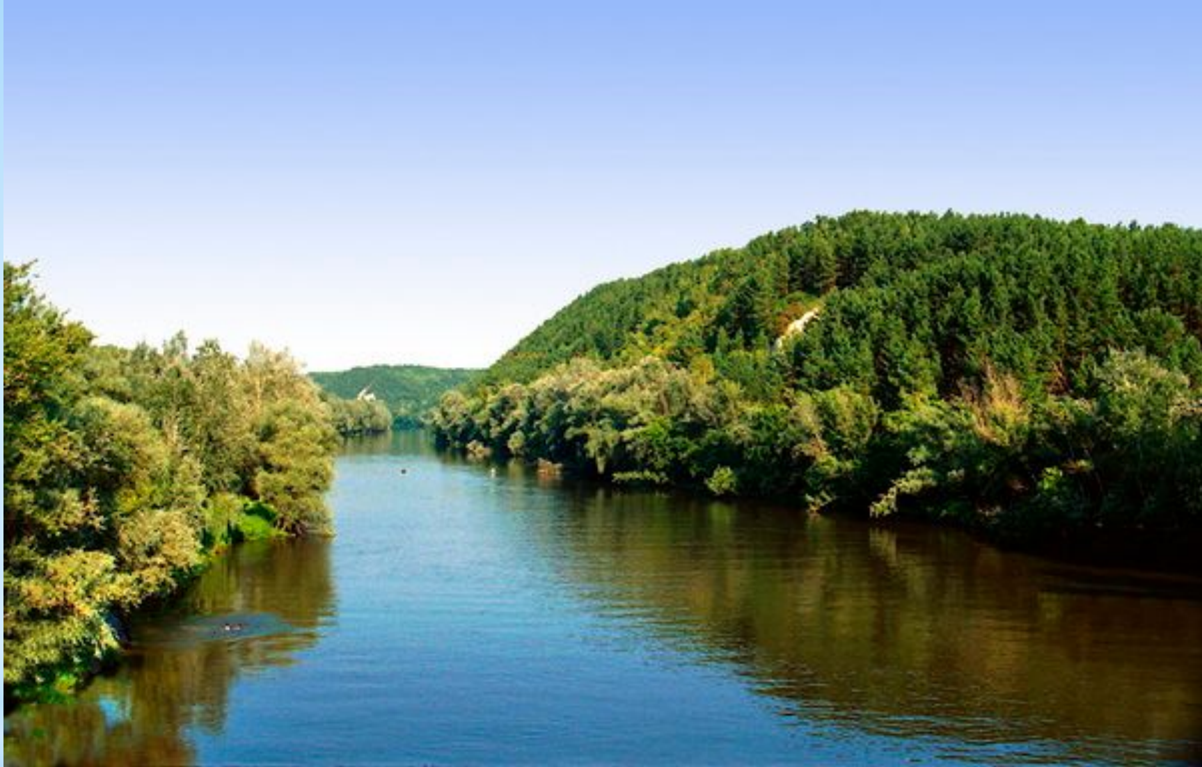
Национальный парк "Святые Горы", долина реки Северский Донец.