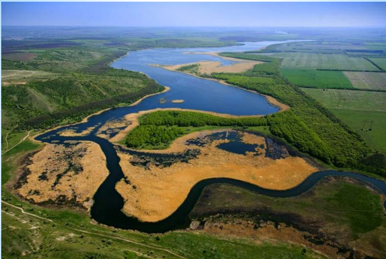
Региональный ландшафтный парк "Донецкий кряж"