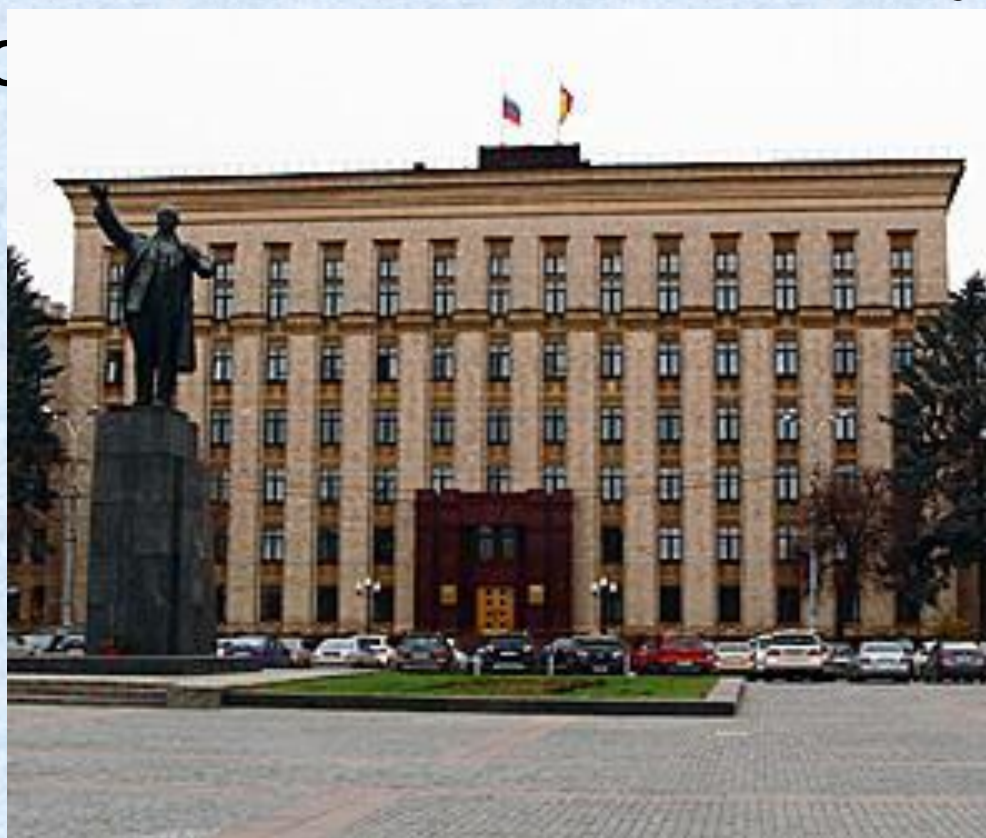
Администрация Воронежской области

Правительство Воронежской области — высший орган исполнительной власти в Воронежской области. Главой правительства является Губернатор Воронежской области.