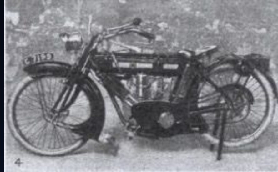
Мотоцикл P&M, участвовавший в первом Международном шестидневном испытании (ISDT) в 1913 году.