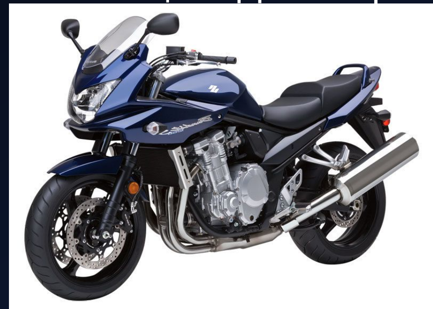
Suzuki GSF1250S (Bandit)

Современный классический мотоцикл может быть любой кубатуры, но то, что объединяет их все в один тип — это геометрия, обеспечивающая прямую (так называемую «классическую») посадку водителя, когда он сидит ровно, не отклоняясь и не опираясь на руль. Такая посадка весьма удобна для длительной езды, и все мотоциклы создаются с учётом этого. Двигатели классических мотоциклов обычно средне форсированные для достижения максимального ресурса.