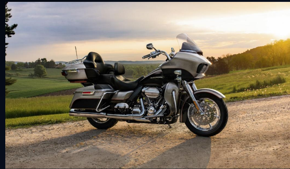
Harley-Davidson ROAD GLIDE ULTRA