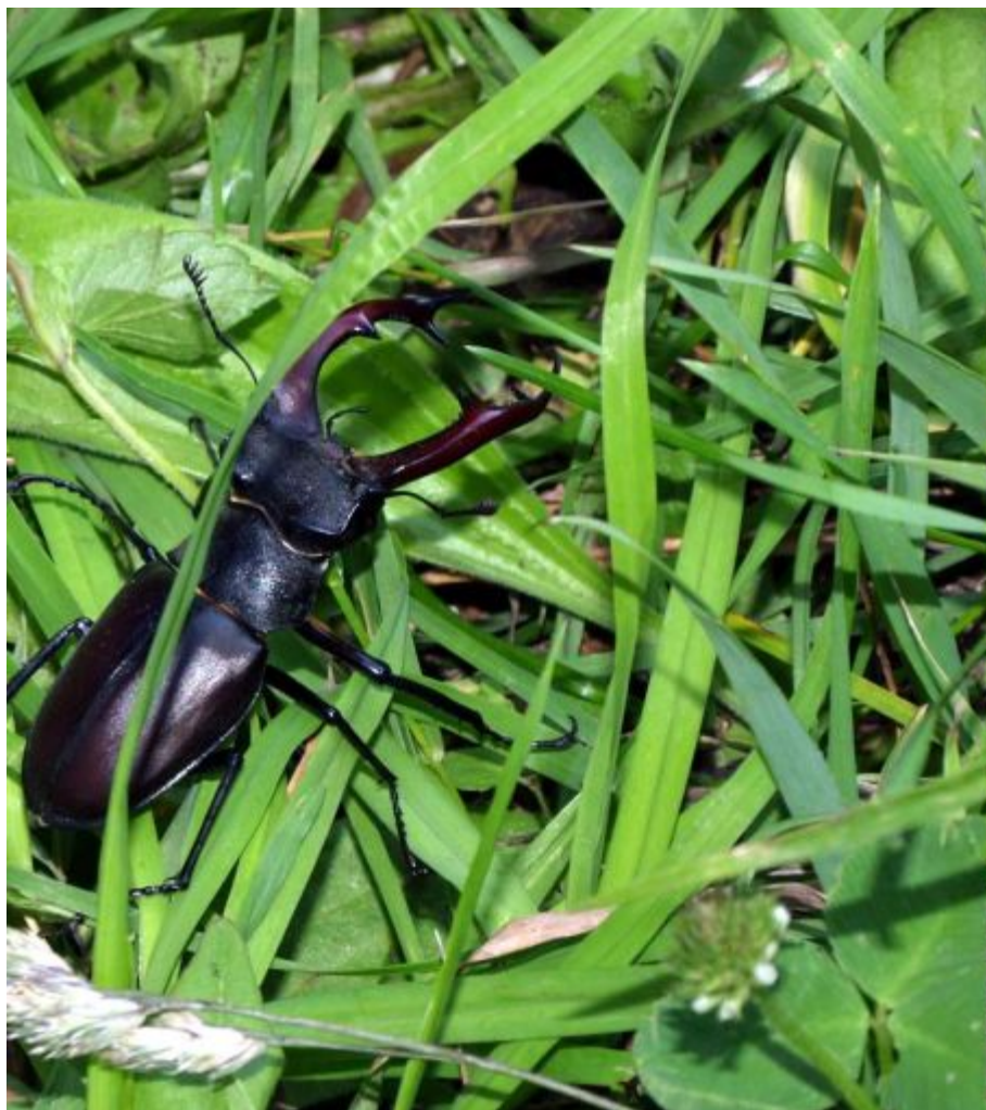
жук - олень