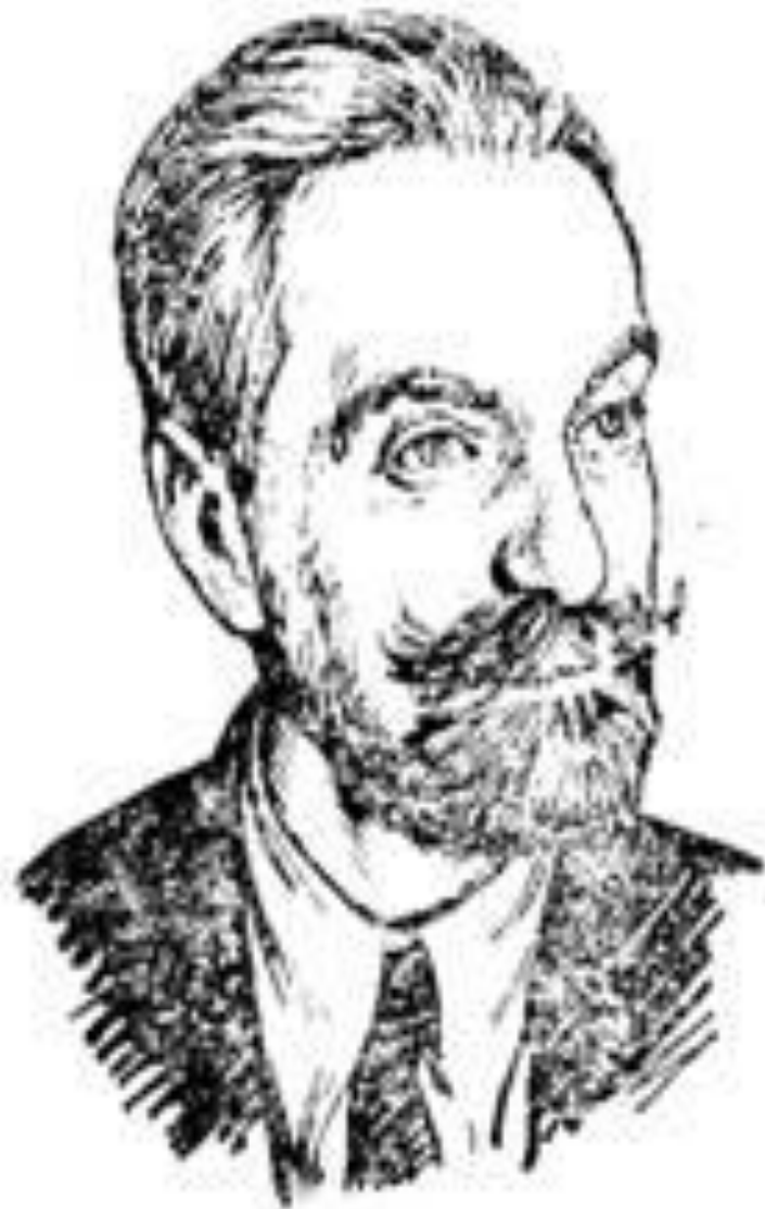
В. П. Кашченко (1870—1943).