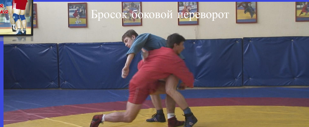
Бросок боковой переворот