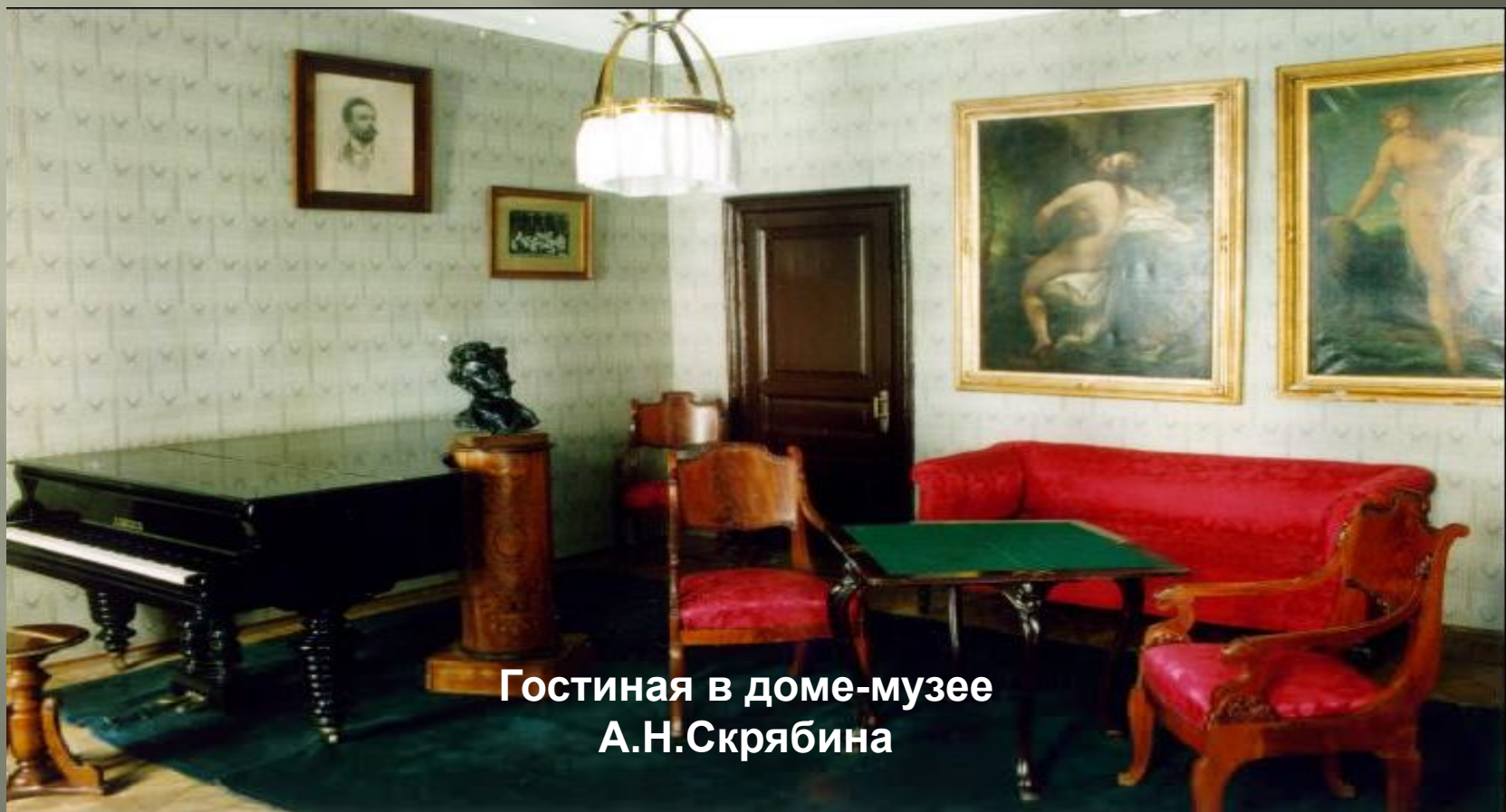
Гостиная в доме-музее А.Н.Скрябина

Творчество Скрябина оказало существенное воздействие на фортепианную и симфоническую музыку 20 в. Получили дальнейшее развитие идеи синтеза музыки и света. В 1922 в помещении последней квартиры Скрябина в Москве организован музей.