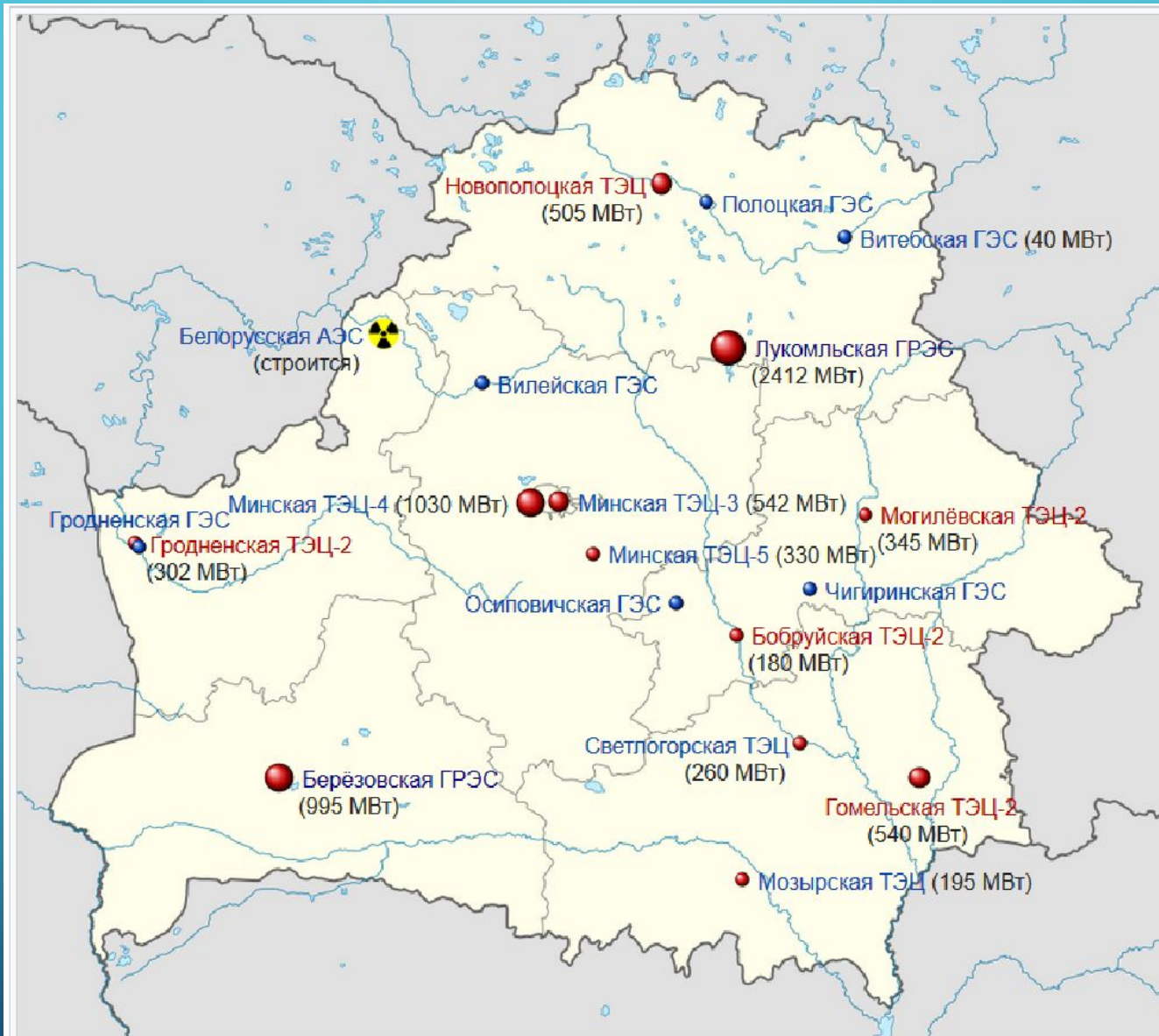
Крупнейшие атомные, тепло- и гидроэлектростанции Республики Беларусь и их установленная мощность