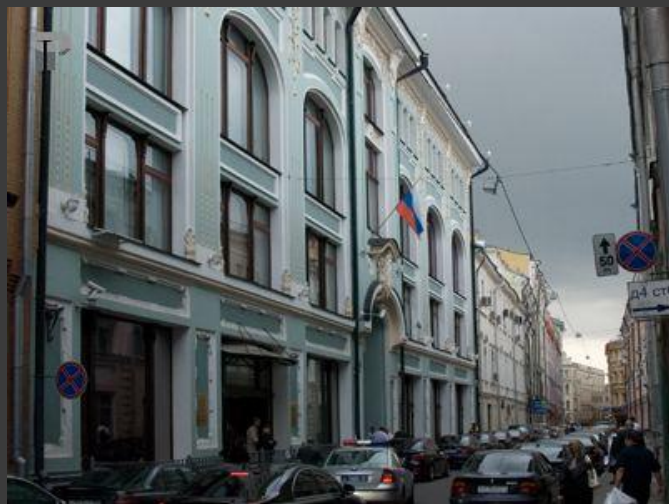
Центральный избирательный комитет