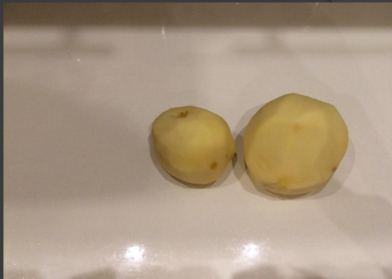
2. Очищенный картофель