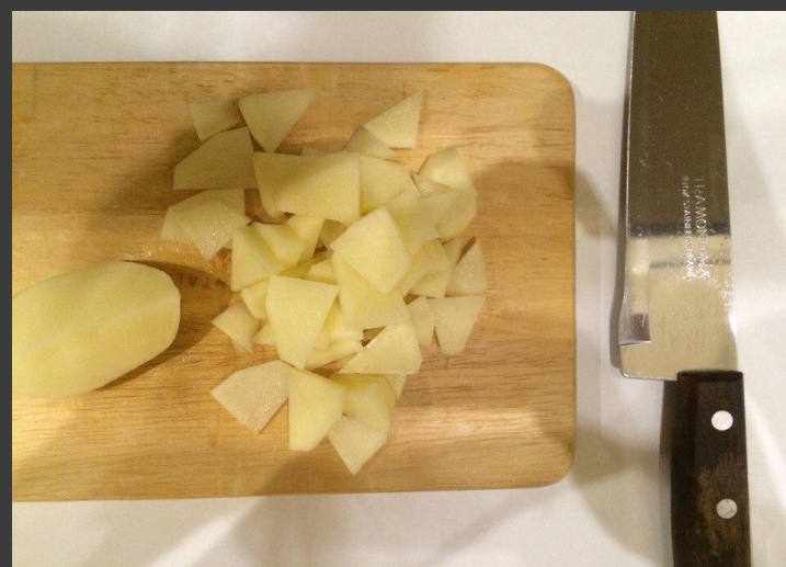
4. Форма нарезки «ломтик» Толщина 0,2-0,5 мм