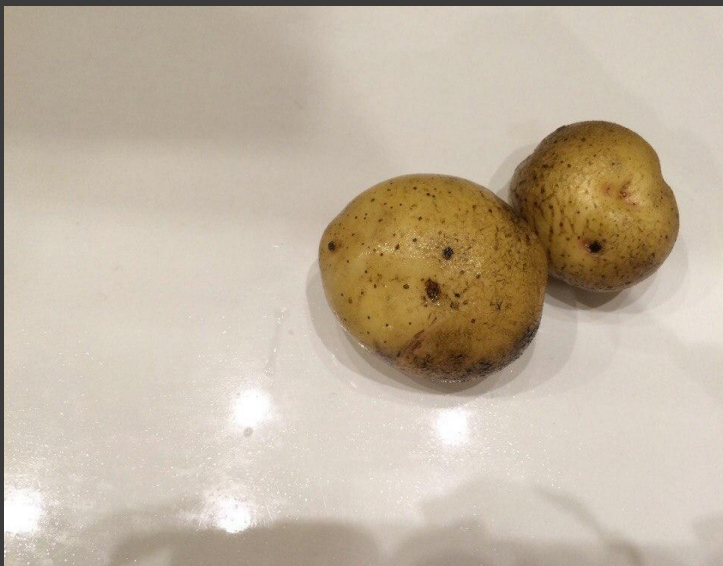
1. Мытый картофель