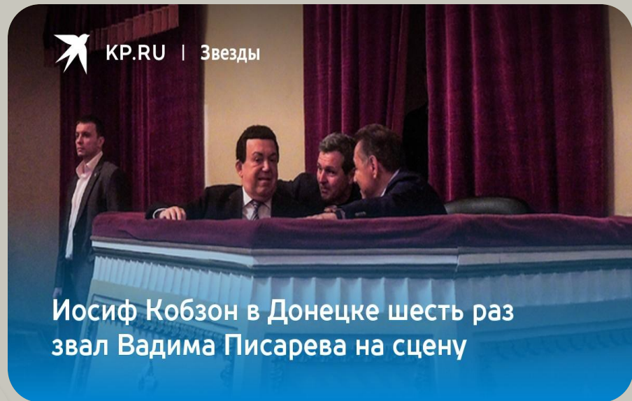
Иосиф Кобзон в Донецке шесть раз звал Вадима Писарева на сцену