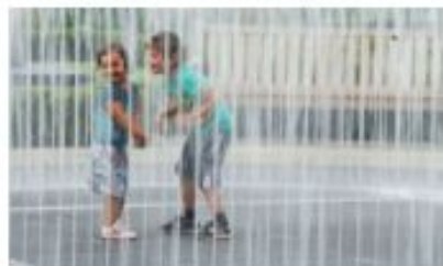
И фонтан «Водопад желаний»

НОВЫЙ ОБЛИК ЦЕНТРАЛЬНОЙ ПЛОЩАДИ ПРИДАСТ МИКРОРАЙОНУ ЯРКИХ КРАСОК И ВДОХНЕТ В НЕГО НОВУЮ ЖИЗНЬ