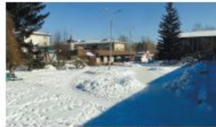
Современное состояние центральной площади Академгородка