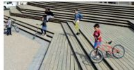
Появятся вот такие лестницы...