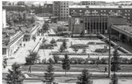
Площадь Академгородка в 60-е годы