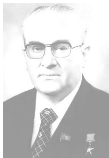
Ю.В.Андропов 1982 - 1984